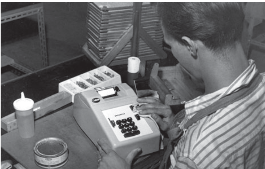
Från tillverkningen av Odhner Junior i Facits fabrik i Juiz de Fera, Brasilien 1960.

Varje ny maskin med ”Bernadottekåpa” som lanserades på marknaden mottogs med lovord för den gedigna anpassningen till produktens funktion och den sköna balanserade formgivningen.