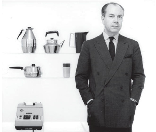
Nobel design. Sigvard Bernadotte med ny version av Original-Odhners elektriska additionsmaskin. Bild ur Vecko Journalen 1959.

1958 erhöll samtliga Facitmodeller en sober ”vikinggrå” färg, 1967 ersattes den vikinggrå färgen av den betydligt ljusare nyansen Facitgrå.