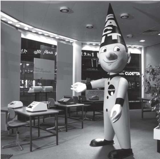
1957 beslutade man kalla alla maskiner som såldes genom Åtvidabergs handelsrörelse för Facit.

För att stimulera försäljningen och ge kontorsmaskinerna karaktär beslöt bolaget 1957 att satsa på enhetlighet i såväl namn som design på samtliga sina produkter. Uppdraget att formge de nya maskinerna tillföll Bernadotte & Björn.