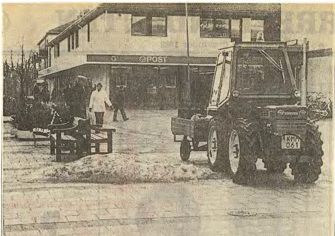
Faktiskt, hittade vi inte en liten, liten snöhög på Tilasplan mitt i Åtvid. Den lilla traktorn som normalt så här års är försedd med snöplog användes nu till att transportera papperskorgar