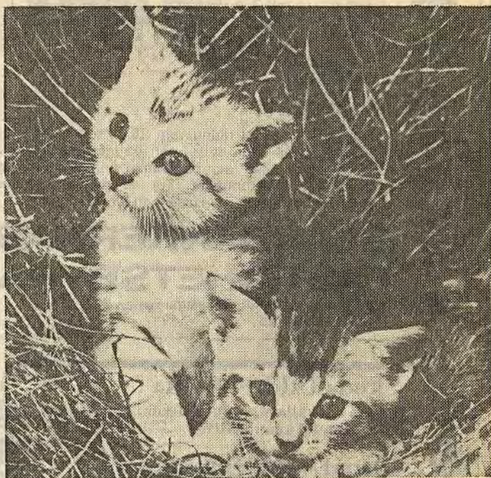
Katastrofalt slut väntar somliga kissemissar i Åtvid