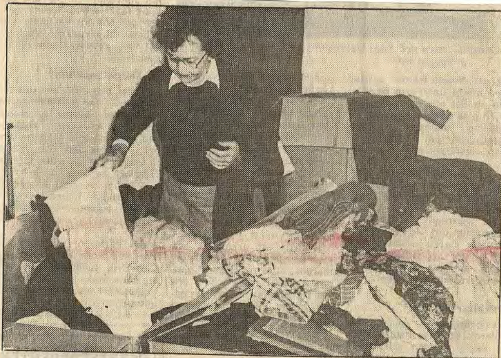
Hälften av hjälpsändningen lastades av i en liten by utanför Linz där ca 400 tjecker och slovakier lever i exil