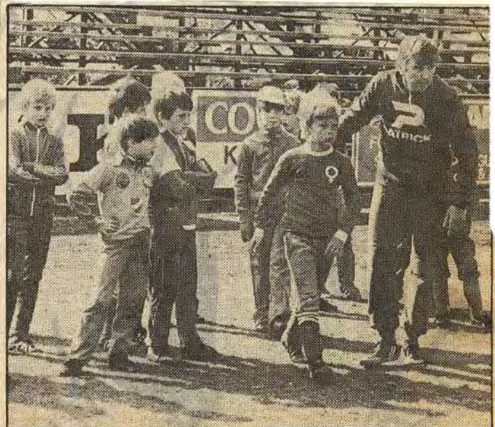
Det är ingen tvekan om att var och en med största allvar går in för Fotbollsskolan