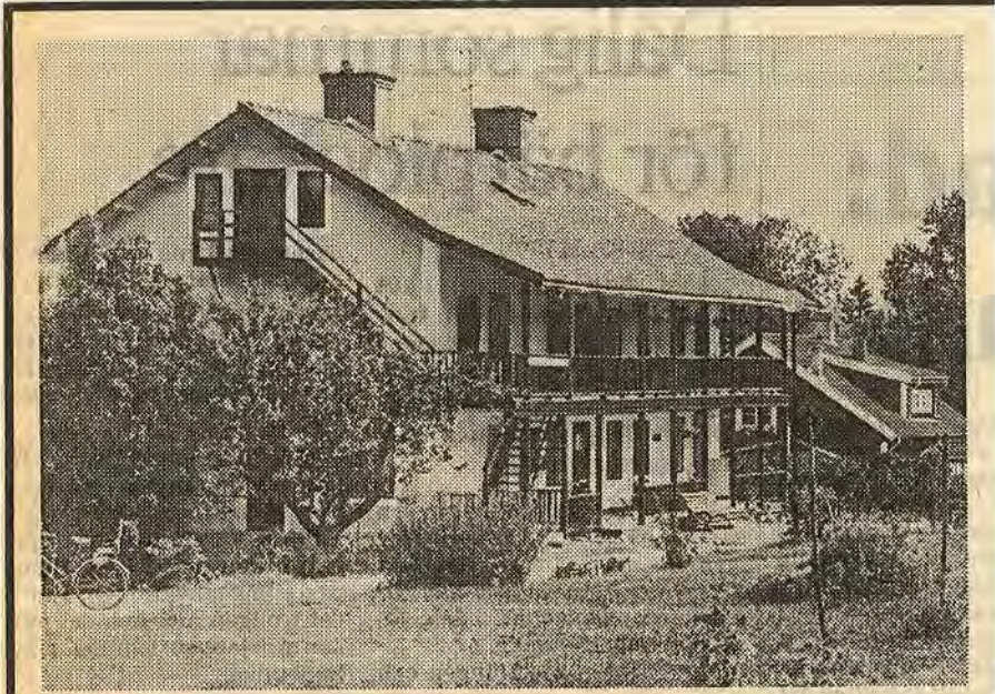
Lapphem i Borkhult. Byggnaden fick namnet sedan man använt överblivet byggnadsvirke. Lapphem används av tillfälliga gäster såsom turister från Västtyskland. I källaren finns en gammaldags bakstuga