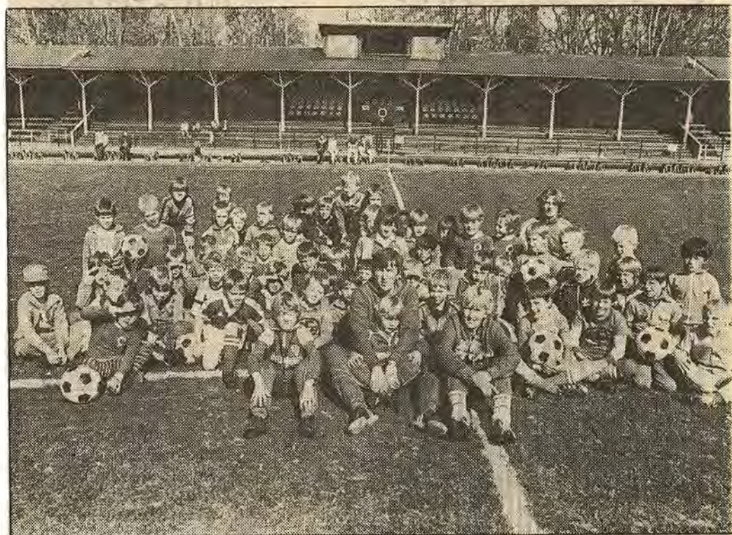
AFF:s fotbollsskola samlad mitt på Kopparvällens A-plan. I år har skolan 50-60 elever 6-9 år