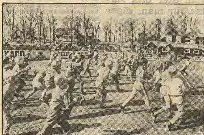
Eleverna i Fotbollsskolan jobbar, sliter, svettas och trivs