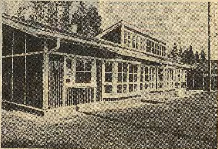
Den här villan imponerade en hel del på delegationen från Åtvidabergshus. Ljust, stort, rymligt och ökonventionellt. Invändigt försedd med trädgårdsrum, gammaldags bakugn och, förstås, stor bastuavdelning

De inhemska husindustrierna svarar för ungefär 95 procent av produktionen. Den övriga biten delas mellan fyra svenska företag.