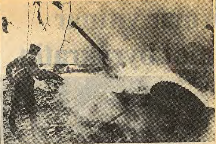
Det gamla sågverket brann ner med blixstens hastighet. Brandmännen från Åtvid och Björsäter kunde inget göra för att rädda träbyggnad och lastbil

Kommunstyrelsen behandlar frågan nästa vecka.