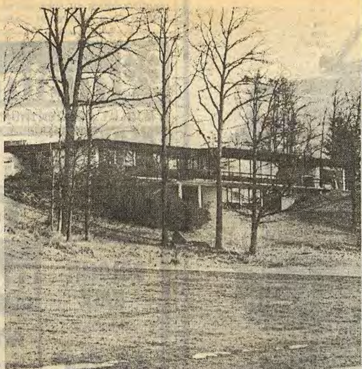
Det lär väl dröja innan det blir så här generöst tilltagna kommunala villatomter i Åtvid

Det som skulle gett plats för ett 30-tal grupphus blir nu i stället 23 småhustomter. I några fall blir tomterna inte mer än 22 m breda. Det innebär att max 13 m breda hus kan byggas.