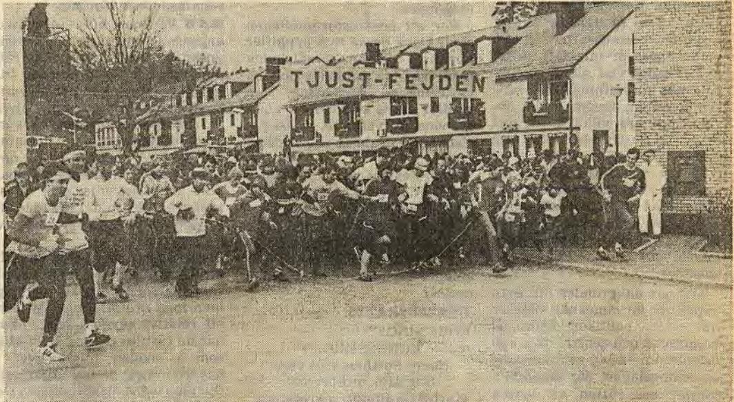
När starten gick var en del så ivriga att de trasslade in sig i startrepet. Men det liksom hela arrangemanget togs med gott humör

Tjustfejden anordnas av Gamleby-Överum Lions club