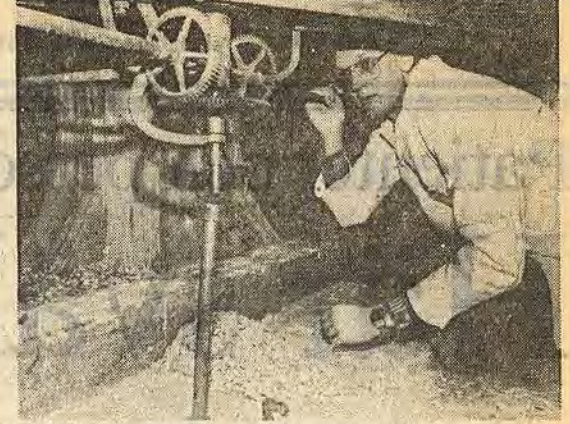
I snart tolv år har klockan stått stilla i Folkets hus. Den här trasiga visaraxeln bär största skulden till att tornuret stannade