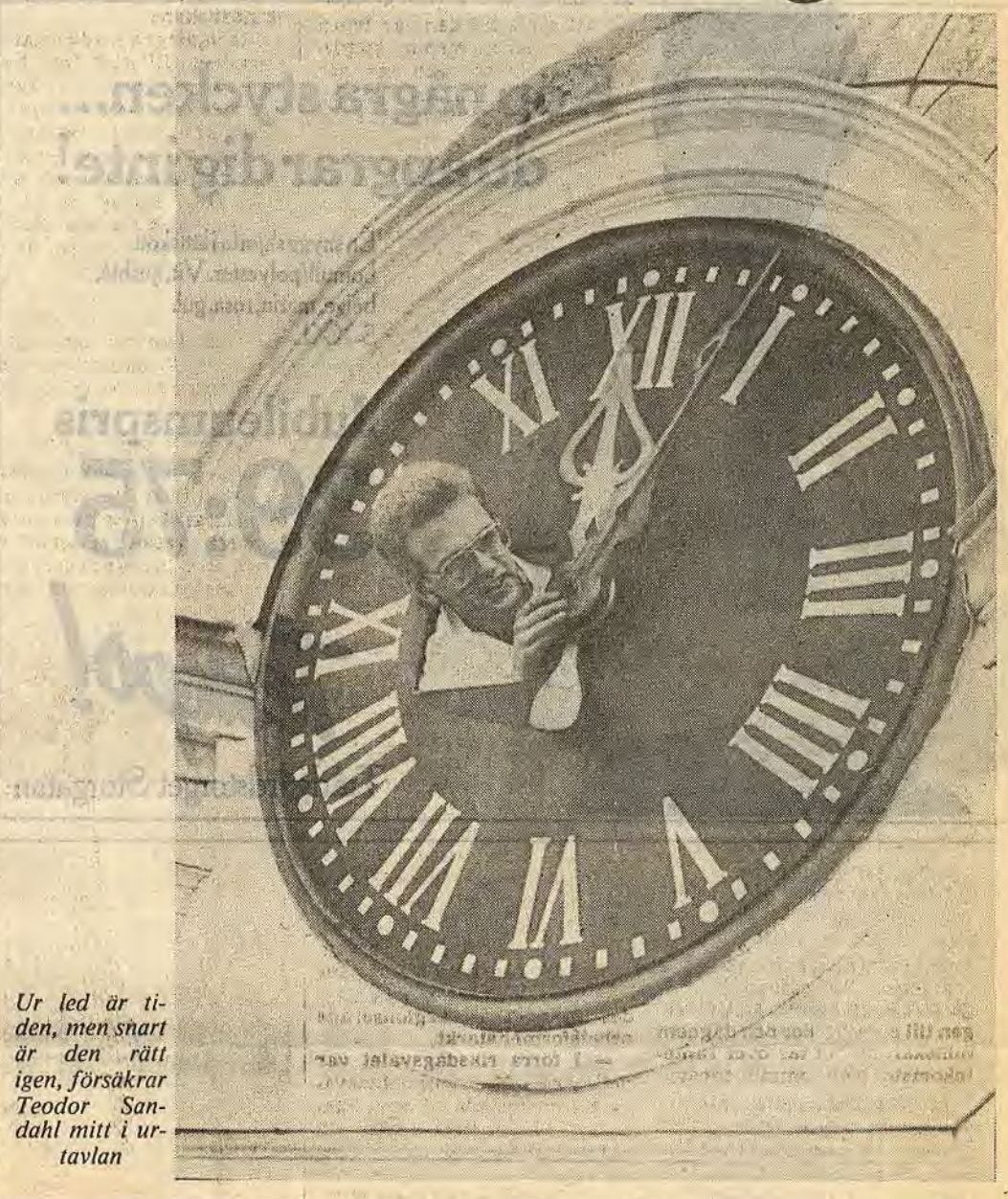
Ur led är tiden, men snart är den rätt igen, försäkrar Teodor Sandahl mitt i urtavlan

Om några dagar skall visaraxeln vara lagad, urverket justerat och lodet på plats. Sedan dras pendeln i gång och tornuret kan åter visa åtvidabergaren vilken tid han lever i och med malmklangen dånande varje kvart erinra om den bruksbygd han är född i.