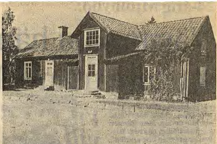
Gamla sjukstugan i Ätvidaberg uppfördes redan 1720. Länsmuseum och myndigheterna i Ätvid ville att byggnaden skulle bevaras medan ägaren, landstinget, ansåg att huset var i alldeles för dåligt skick