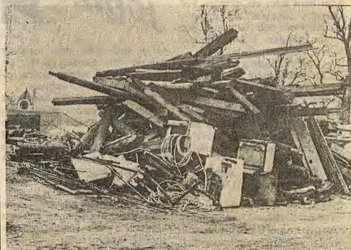
Vad som i dag återstår av den 262 år gamla sjukstugan i Ätvidaberg är några högar med rivningsvirke