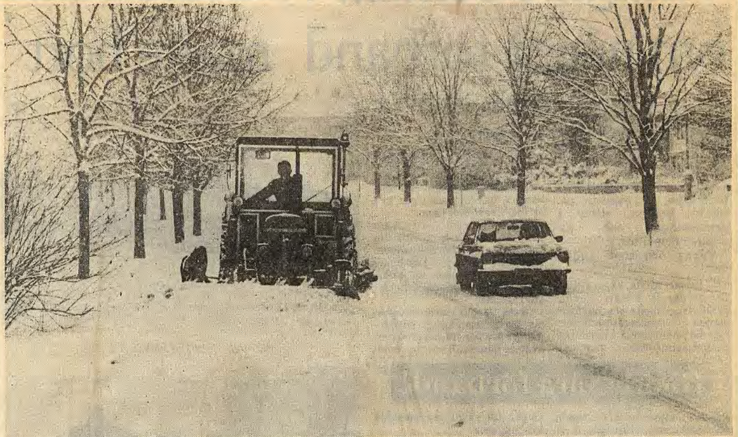
Vid ett riktigt snöfall kan vägförvaltningen sätta in 125 enheter. Dygnskostnaderna kan uppgå till en kvarts miljon kr