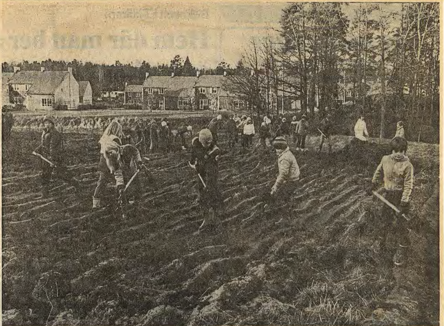
Nästa läsår blir ämnet hemkunskap obligatoriskt i mellanstadiet. Men redan i år pågår försöksverksamhet på Långbrottskolan i Åtvidaberg. Bl a har eleverna fått hand om en egen kolonilott där det så småningom skall växa allehanda ätbara saker. Häromdagen var det dags för gödsling