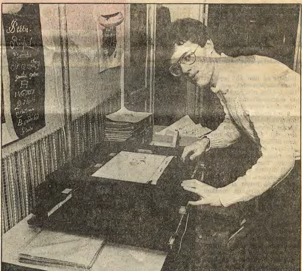
För en tid sedan föddes idén att göra en tidning om tecknad film för Sveriges animatörer

Belätet som måste målas varje gång den intelligande ladugården målas om. Annars kommer byggnaden att brinna.