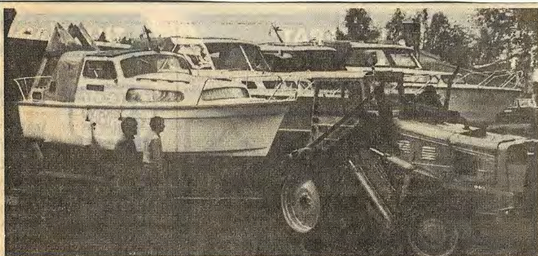
ÅTVIDABERGS BÅTKLUBB har som den inlandsklubb den är ändå över 150 medlemmar och sin "hemmahamn" i Loftahammar. De senaste veckorna har man haft ett styvt jobb att få upp båtarna på land. I tre omgångar har man med maskiner och frivillig handkraft hjälps åt och nu är också de flesta fartygen i tryggt förvar inför vintern