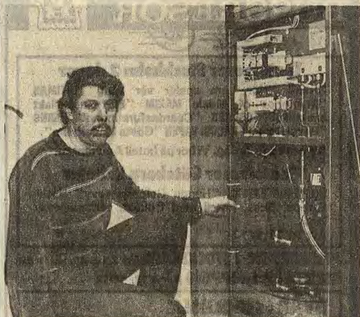
Nere i källaren, strax intill den gamla trotjänaren för olje- och vedeldning, står brunnsvärmesystemets hjärta. I aggregatet "mjölkas" det sjugradiga grundvattnet på två grader. Dessa går åt för att koka upp freonvätska till het gas som i sin tur värmer upp ledningsvattnet