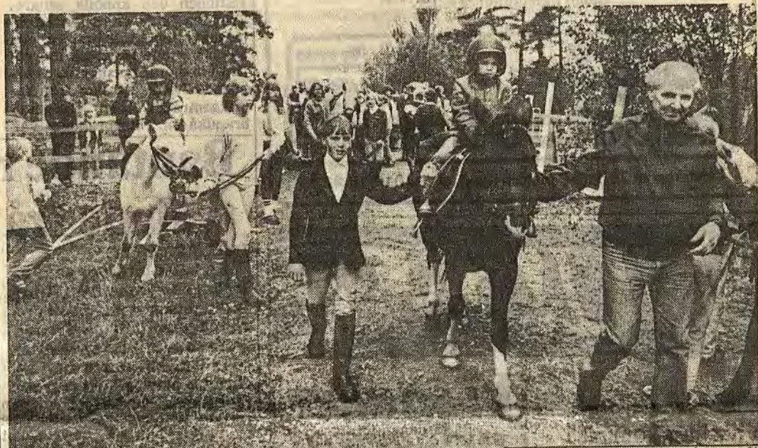
Så länge ridklubbens jubileumsarrangemang varade stod de allra minsta troget i lång kö för att få rida några minuter på en snäll ponny

Trots ett ruggigt väder kom närmare 300 personer till Vrånghult utanför Åtvidaberg när 10-årsjubilerande Åtvidabergs ridklubb visade upp delar av sin verksamhet. Många passade också på tillfället att närmare beskåda det stora upprustningsjobb som klubbens medlemmar lagt ner på stall och andra utrymmen.