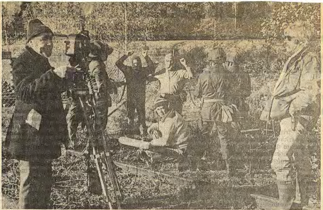
Terroristerna har övermannats av de effektiva hemvärnsmännen i Åtvidaberg. Allt medan filmteamet funderar på hur man skall få litet "action" i det följande momentet