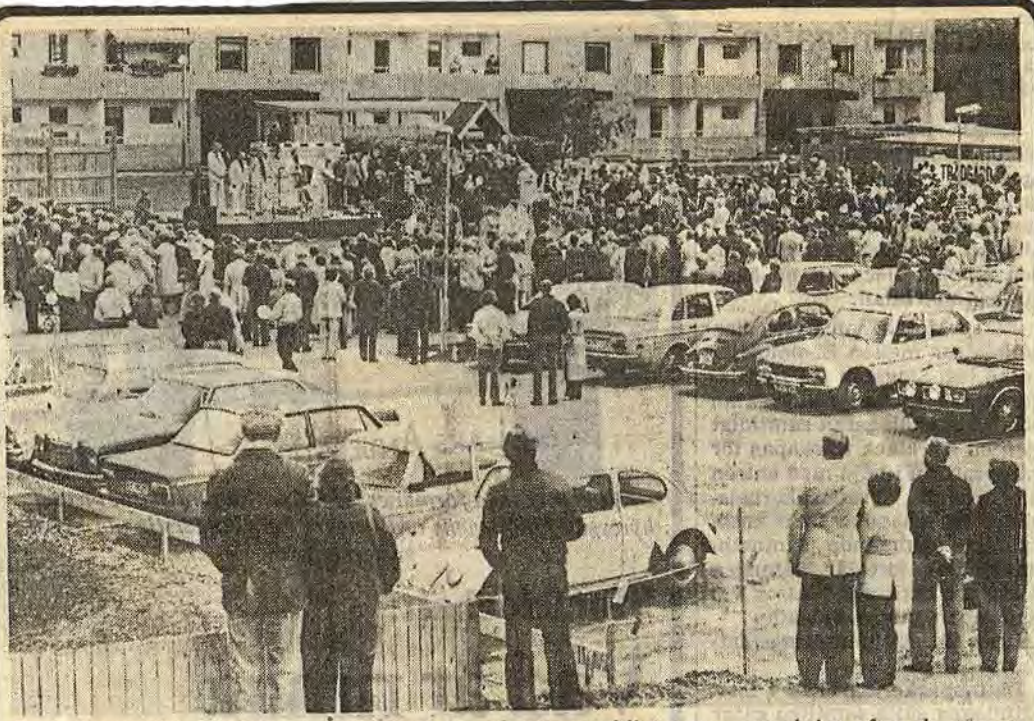
Bostadsområdet Eksätter i Åtvidaberg är på väg att bli än mer attraktivt efter de senaste månadernas miljösatsning på den yttre miljön. Det "nya" Eksätter visades upp för några veckor sedan vid den s k Eksättersdagen då det kom massor med folk. Som ett direkt resultat av den dagen fick man åtminstone fyra nya hyresgäster