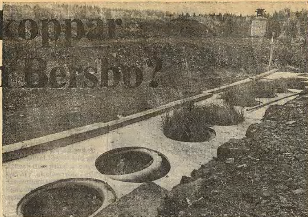
Bland alla forskningsprojekt som pågår i Bersbo för att bli förhindra fortsatt spridning av giftiga metaller, ingår ett försök med växtetablering. Hela området skulle kunna täckas med morän och matjord och sedan besås med växtlighet