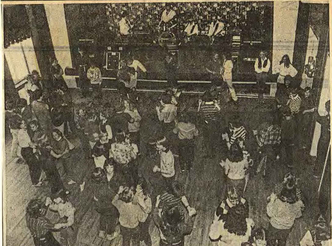
Det var full fart på avslutningen på stuffa-kursen i Åtvidaberg på söndagen. Här är det foxtrot som å det elegantaste praktiseras