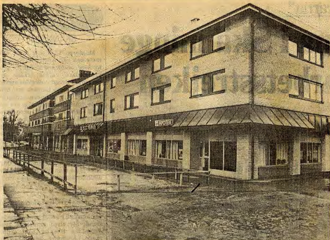
Det här är Trekanten. Det största enskilda byggprojektet i Åtvidaberg sedan Örsättersfabriken och vid byggstarten kostnadsberäknat till 25 milj kr. Ett kommunalt bolag vill nu få överta rätten att köpa hela komplexet