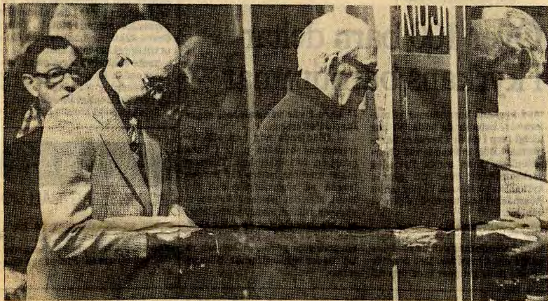
Efter programmet samlas man i en lång kö för att till en billig penning lösa ut kaffe och bröd