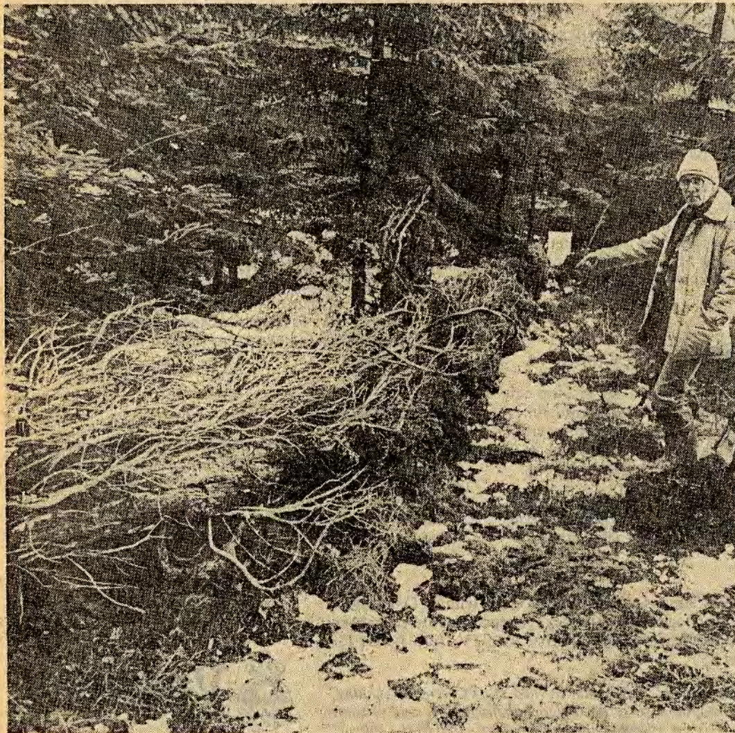
Lars Nygren visar på den kullfallna jätteenen vid sjön Glypen i Ätvidaberg. Omkring fyra meter vid rotändan av den 18,5 m långa enen syns inte på bilden