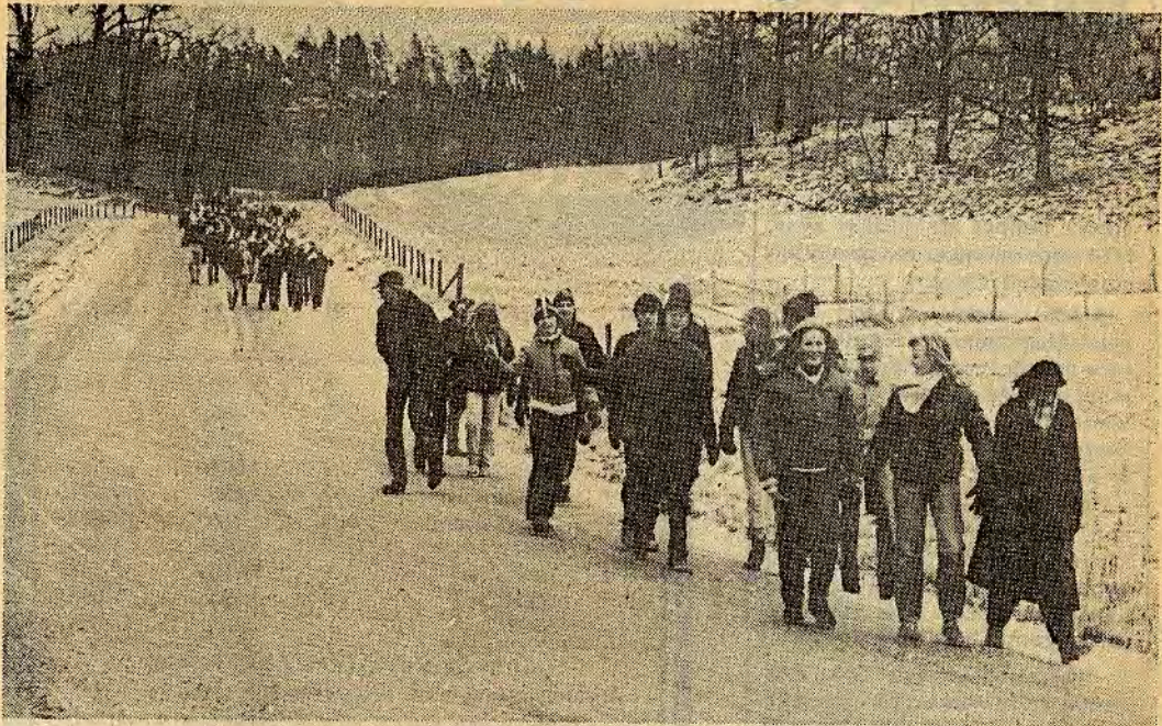
Den dåliga vintern satte käppar i hjulet för en halv friluftsdag för drygt 600 högstadiel elever i Åtvidaberg. I stället för skidåkning m m blev det en milslång promenad

— Det finns ett ambitiöst upplagt program för den här halva friluftsdagen med skidåkning, utförsåkning och skridsko. Men vad ska man göra? Vi har re-