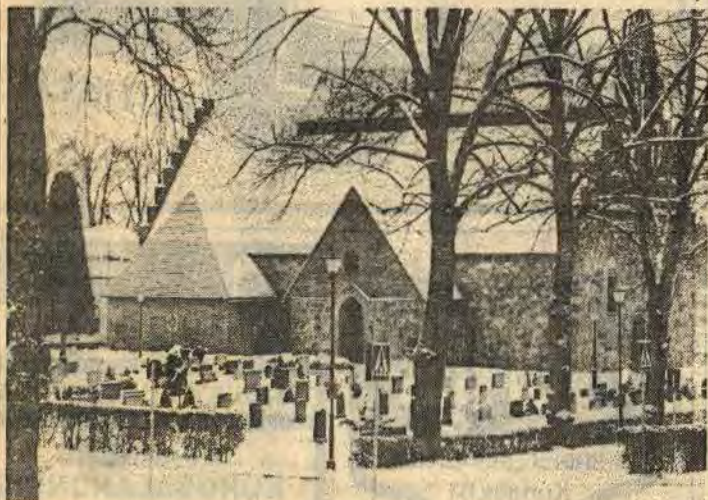
Åtvids gamla kyrka är inte längre någon ruin, som synes

Den som har en sommarstuga där soporna hämtas tio gånger per år får en höjning av avgiften med 32 kr till 132 kr. Varje extrahämtning kommer i fortsättningen att kosta 31 kr i stället för som tidigare 26 kr.