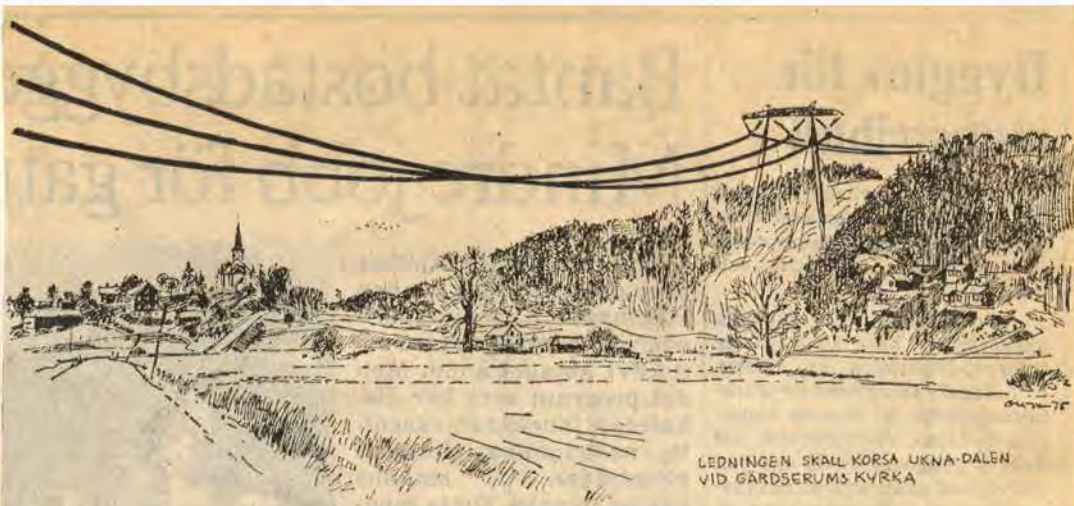
LEDNINGEN SKALL KORSÄ UKNÄ-DALÉN VID GÅRDSERUMS KYRKA

Kantorsbostad till salu. Kommunstyrelsen har beslutat sälja den s k kantorsbostaden i Faleum. Den nuvarande hyresgästen har erbjudits att köpa den men avstått från erbjudandet.