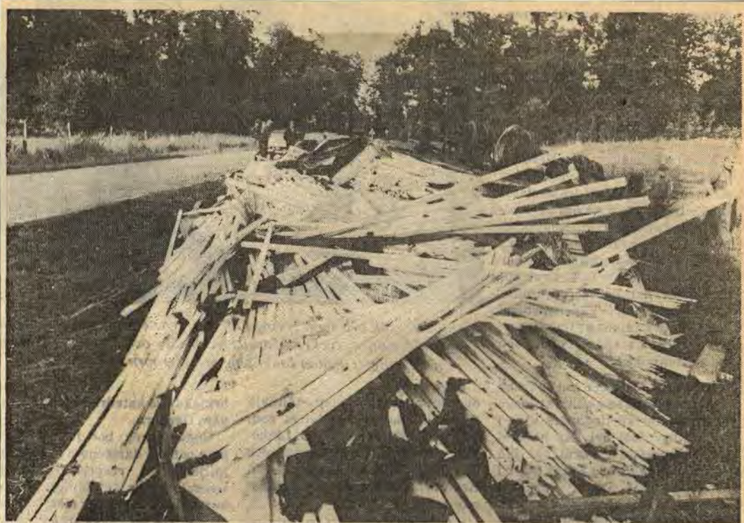
TRETTIO KUBIKMETER hyllat virke hamnade i en ordentlig röra i diket vid infarten från Kisa till Åtvidaberg på torsdagen. Olyckan inträffade när en virkestransport var på väg från Viresjö såg till Göteborgs hamn. Föraren till transporten fick i en vänsterkurva möte. I samband med detta hamnade släpet i diket. En första besiktning tyder på, säger polisen, att en bristfällig kopplingsanordning gjorde att släpvagnen släppte och dråsade ner i diket. Ingen människa kom till skada