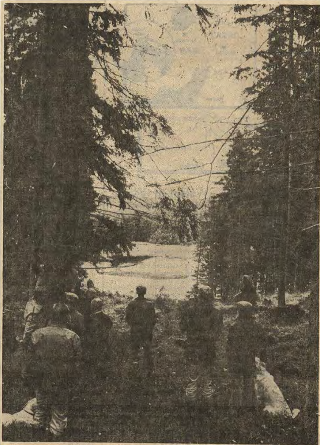
Många av de skogligt kunniga deltagarna på exkursionen hade en annan syn på den öppning som här har gjorts i skogen mot sjön Lilla Bjän än den intervjuade "allmänheten". Den senare gruppen satte ett högt betyg på siktröjningen