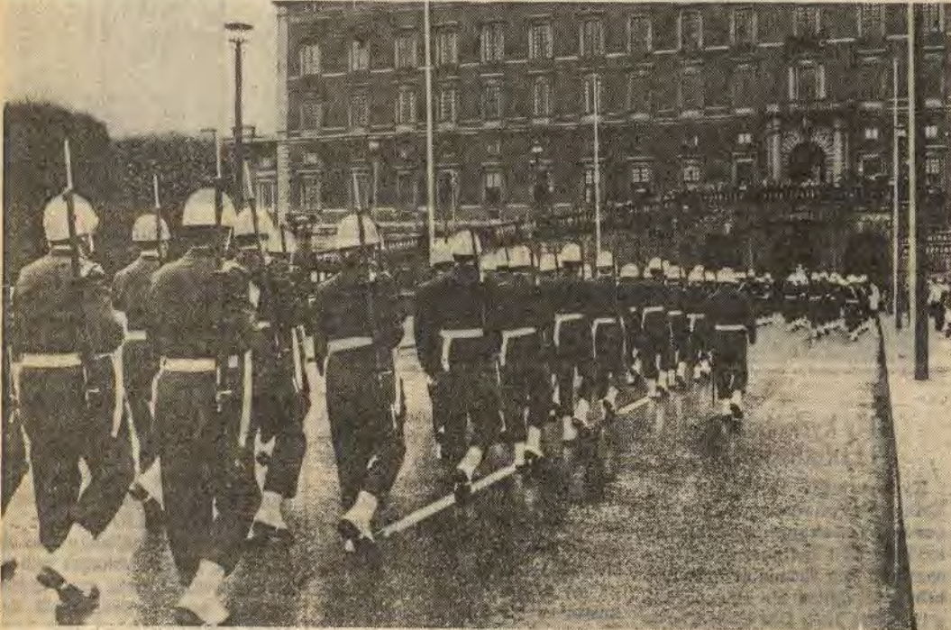
Så här såg det ut häromåret när Åtvidabergs hemvärnskrets var på väg att under ett dygn svara för säkerheten på Stockholms slott. Nu är det dags igen. För sjunde året i rad