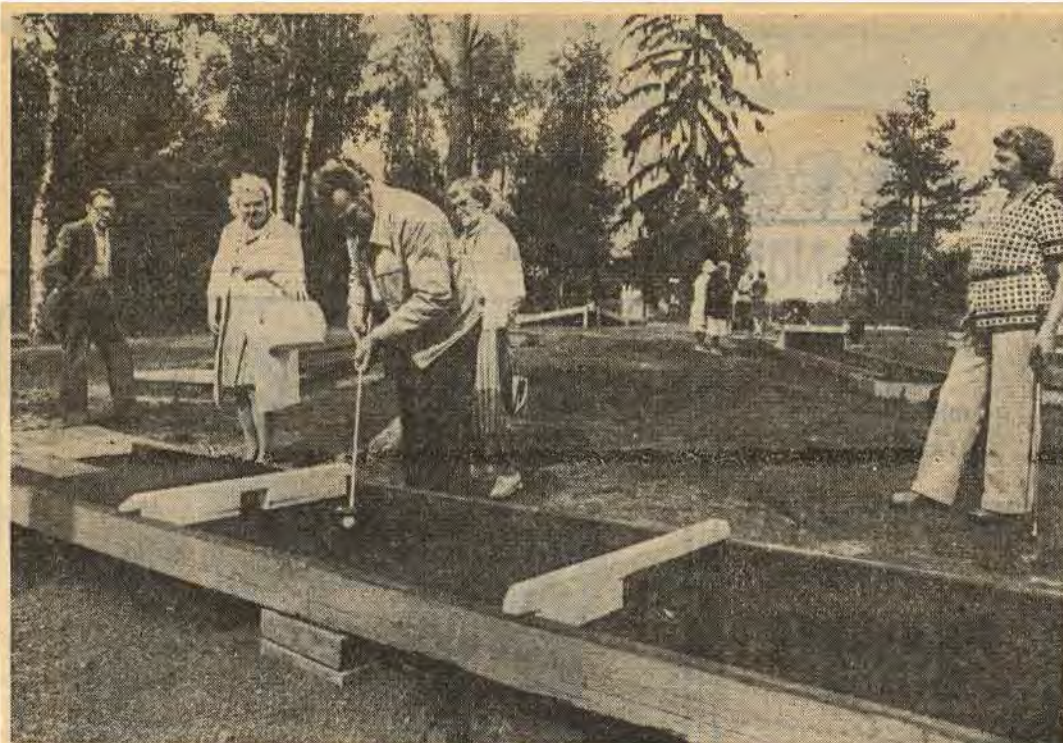
Det var många i Åtvidabergs pensionärsförening som på tisdagen passade på tillfället att pröva den minigolfbana som kommit till på föreningens eget initiativ. Svårt ibland, kanske. Men roligt

Det kan tilläggas att den högsta alkoholkoncentration som hittills uppmätts hos en människa var 6,56 promille. Det var hos en engelsman som greps 1976 sedan han försökt lifta. Han är död nu.