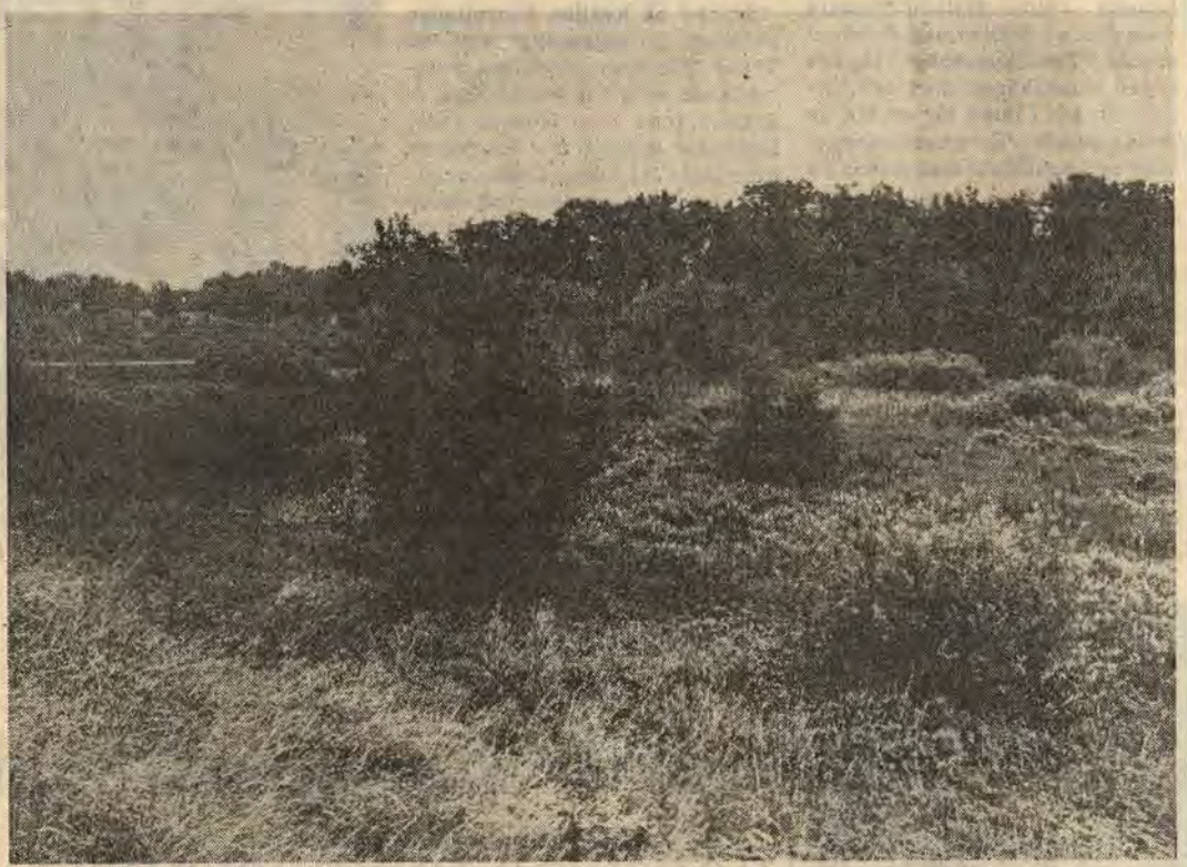
Det s k Tempelkärrret vid Bysjöns sydspets i Åtvidaberg anses så värdefullt att såväl länsstyrelsen som Åtvidabergs kommun menar att det bör hänföras till skyddsklass I, dvs ur naturvårdssynpunkt mycket värdefullt och bör bevaras

Kommunstyrelsen i Åtvidaberg har nu yttrat sig över länsstyrelsens förslag till klassificering av olika myrmarker i Åtvidabergs kommun. Man har inga invändningar att göra mot förslaget. Tvärtom anser kommunstyrelsen att inventeringen är väl genomarbetad.