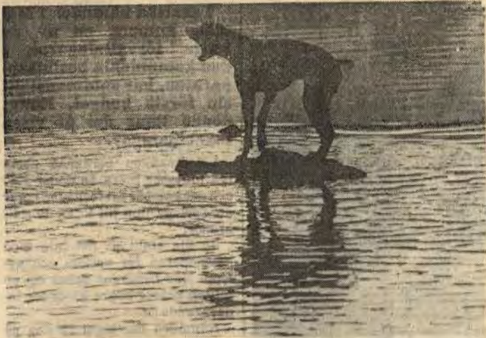
Hundskattepengar kan komma att delvis gå till djursjukhus i framtiden

Ännu en förändring antogs, vilken innebär att kommunerna ges rätt att påföra dubbel hundskatt för den hundägare som underlåter att anmäla innehav av hund. Nekar hundägaren till förseelsen kan kommunen anmäla hundägaren till åtal med dagsböter som påföljd. I dag är bötesbeloppet maximerat till 500 kr.