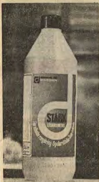
Åtvidabergsfirma får påskrivit för rödspirit som inte är rödspirit

Folkparkens minigolfbana ska till nästa säsong få belysning. Till ändamålet har kommunfullmäktige beviljat anslag med 35 000 kr. Fritidsnämnden har tagit in anbud på tio belysningspunkter till en kostnad på 15 500 kr.