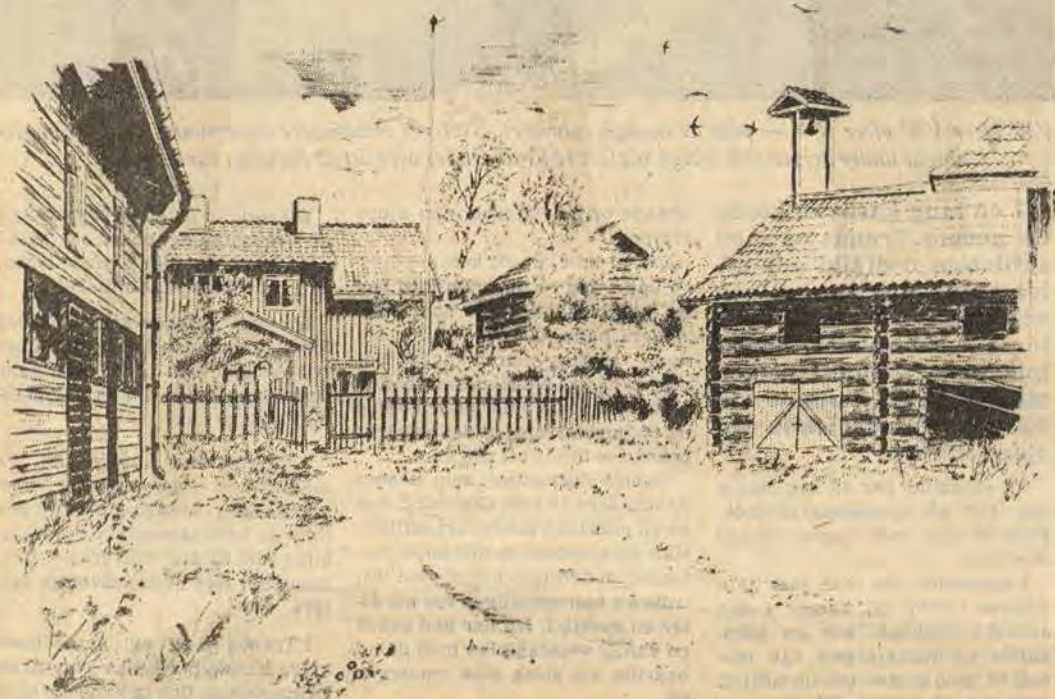
Ristskeda i Yxnerums socken ingår också i kulturminnesvårdsprogrammet för Åtvidaberg. En enhetlig, väl sammanhållen gårdsbebyggelse i utpräglad gotisk form med flera äldre ekonomibyggnader. Fram till 1941 hörde Ristskeda till Burenskiöldska fideikommisset. Fastigheten finns omtalad i köpebrev från tiden kring 1700. Utsikten från gårdstunet och genom björkhagen bort över sjön Saken anses magnifik

Text: CHRISTER BERG Teckningar: OLOF SÖDERBÄCK