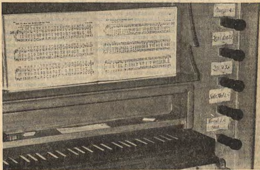
Spelbordet på Gamla kyrkans orgel är märkligt bl a genom att tangenterna manualen har ombytta färger. Undertangenterna är svarta och övertangenterna vita