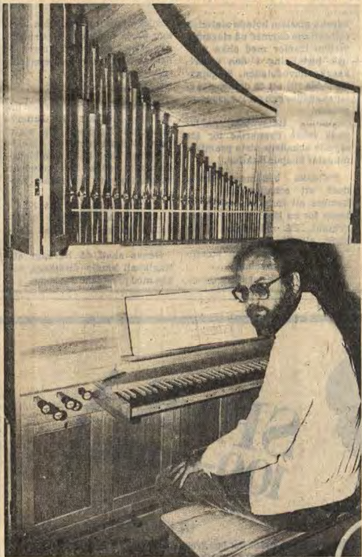
Den gamla tramporgeln i gravkapellet på Åtvids nya kyrkogård har alldeles nyligen ersatts med en liten fin piporgel som ger en helt annan dimension åt sorgeakterna