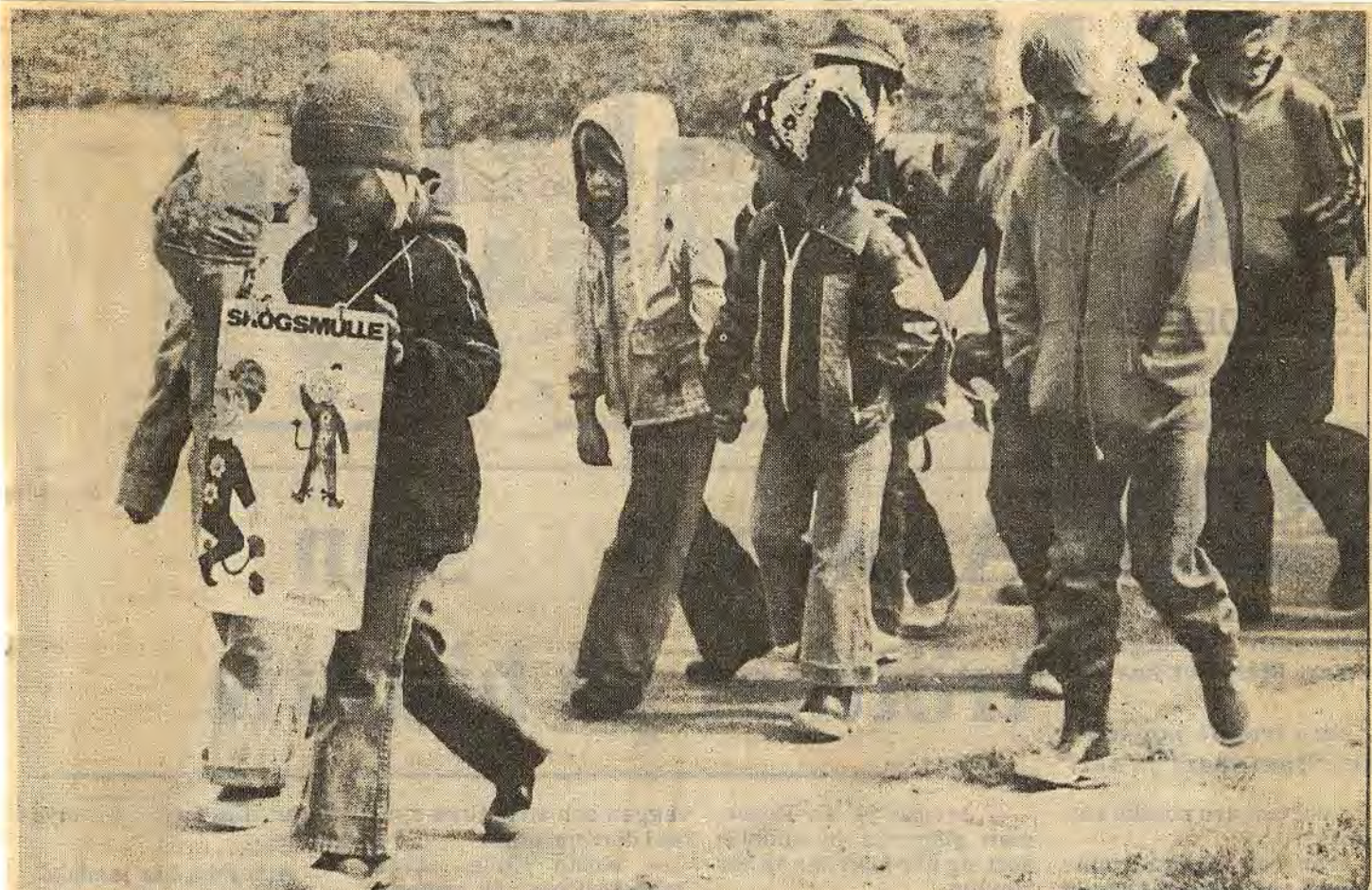
I skogskanten mötte jag en lång rad barn. Först gick en flicka med ett konstigt plakat på magen