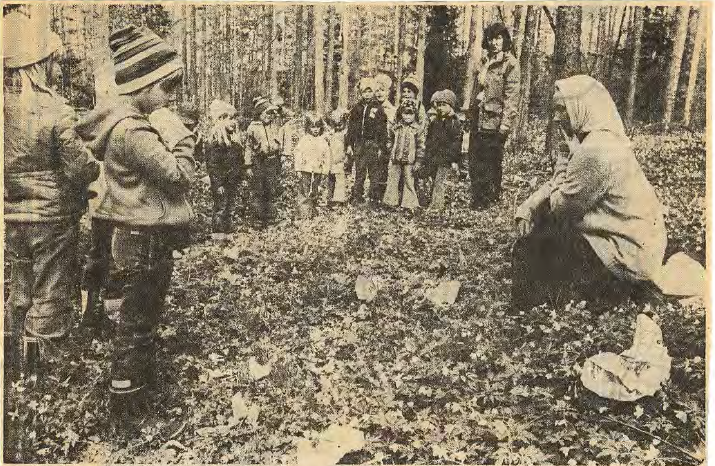
Oj då! Får man inte slänga papper och skräp omkring sig i naturen? Förlåt så mycket! sa tanten med sjalett och fräknar