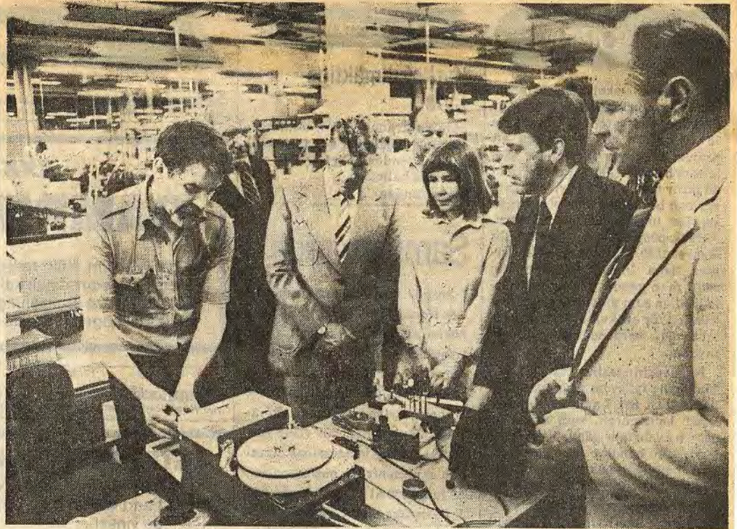
De finska gästerna tar intresserat del av tillverkningen på Facit