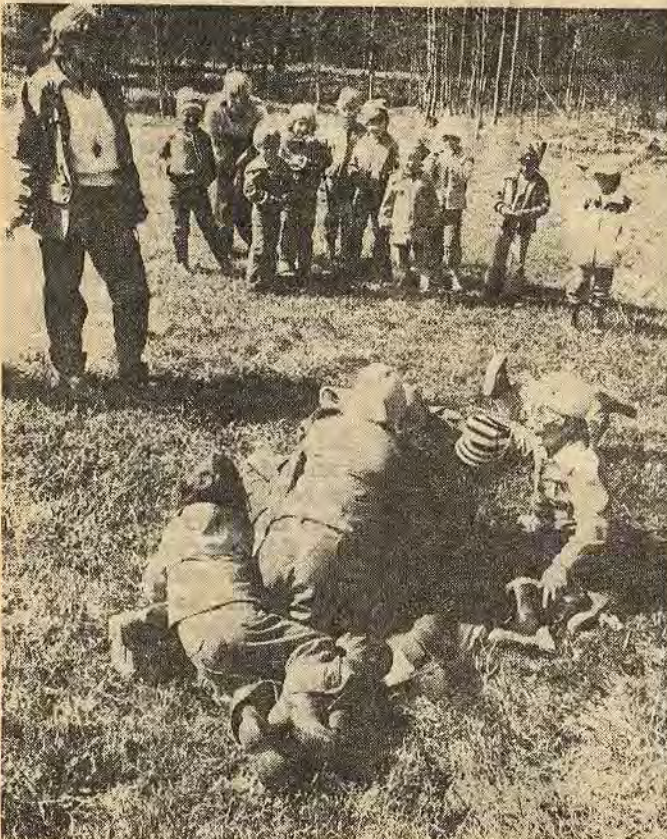
Efter fikarasten lekte man Mulle bak trädet där några av barnen skulle gissa vad de andra föreställde. Här ska rätta svaret vara en hög med stenar