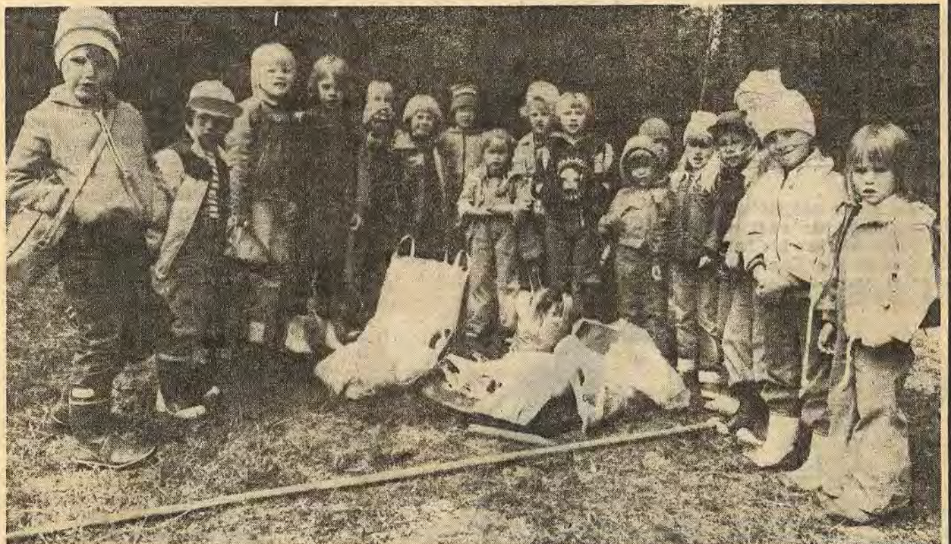
Så här mycket skräp och en massa bräder med spikar därtill hittade barnen på mindre än en kvart. Blå för alla som skräpar ner, sade bar- nen