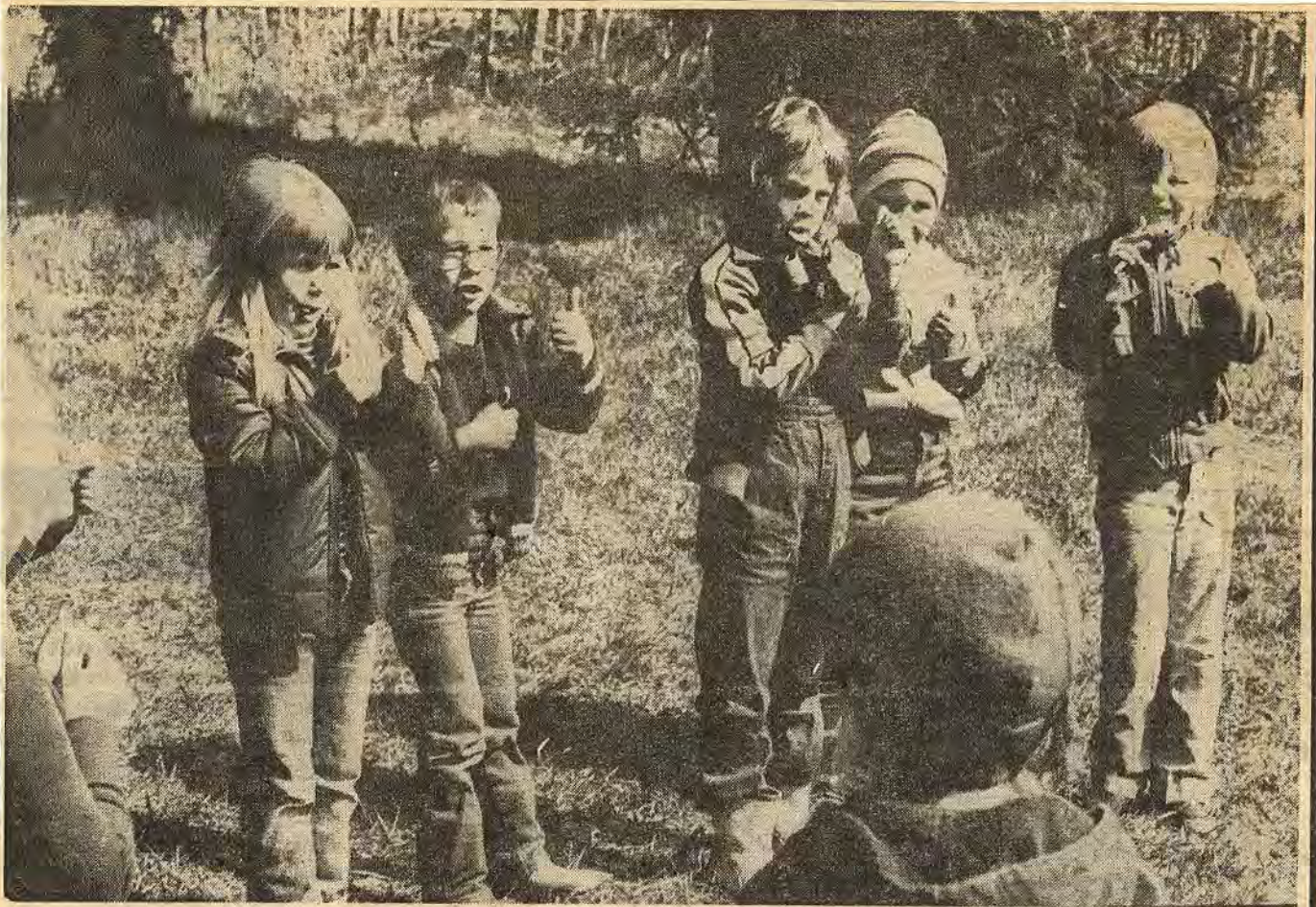
Sedan sjöng man visan om Mulle och Fjällfina