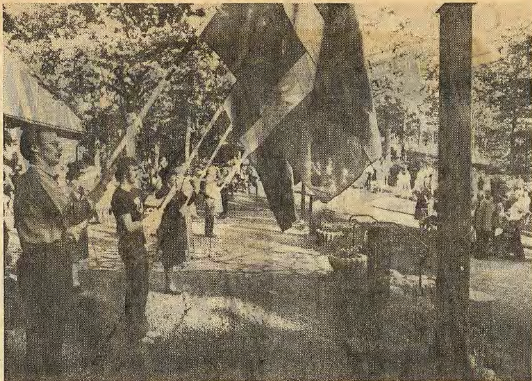
Musikveckan i Åtvidaberg inleddes traditionsenligt i samband med firandet av Svenska flaggans dag vid Hembygdsgården dit hundratals festklädda människor infunnit sig