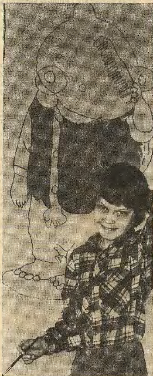
Uppehållsrummet målades om med Nalle Puh på väggen