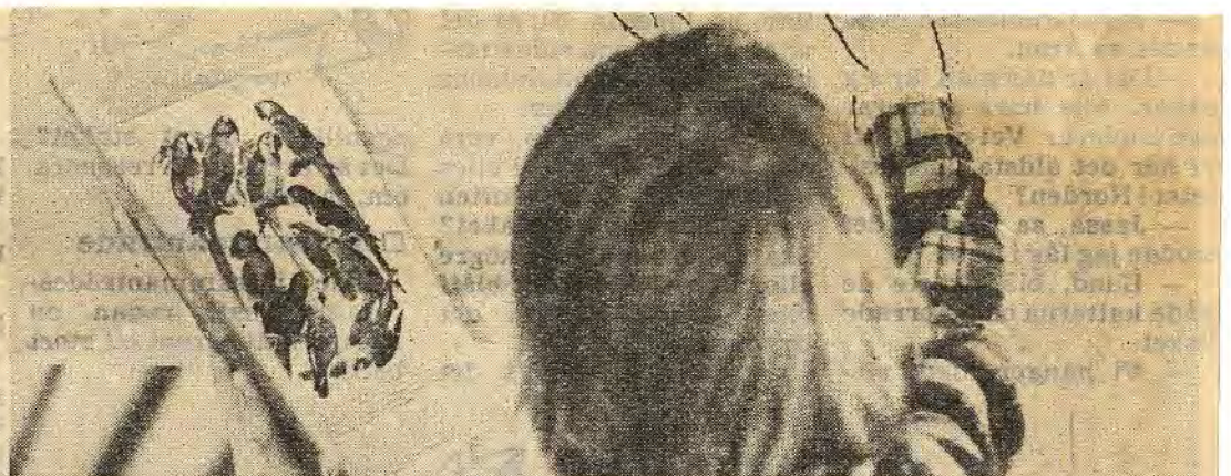
Med hjälp av en fågelbok kan man bestämma färgerna på en papegoja