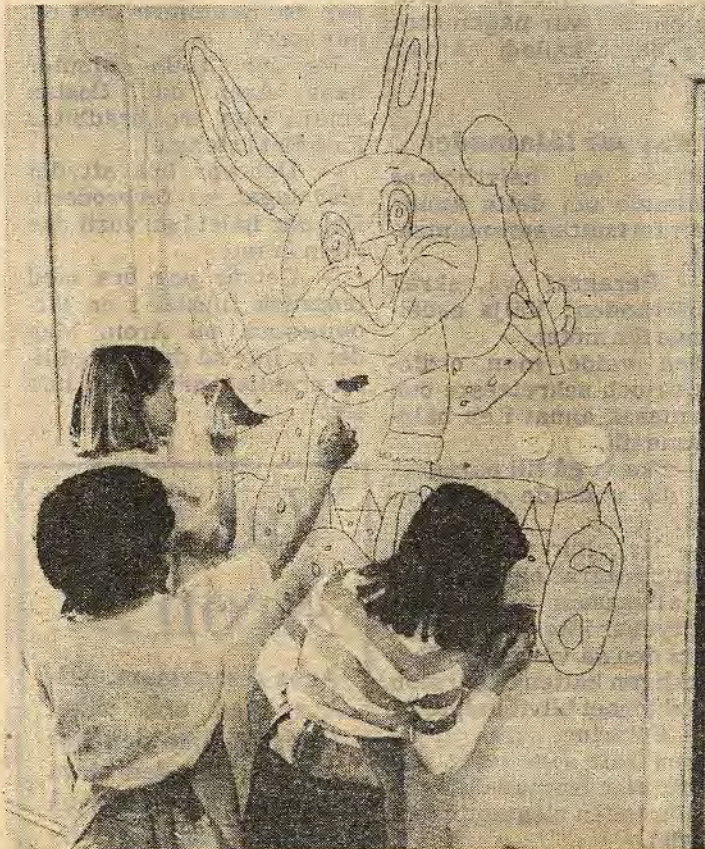
Det är många små och stora ytor på en uppklädd kanin