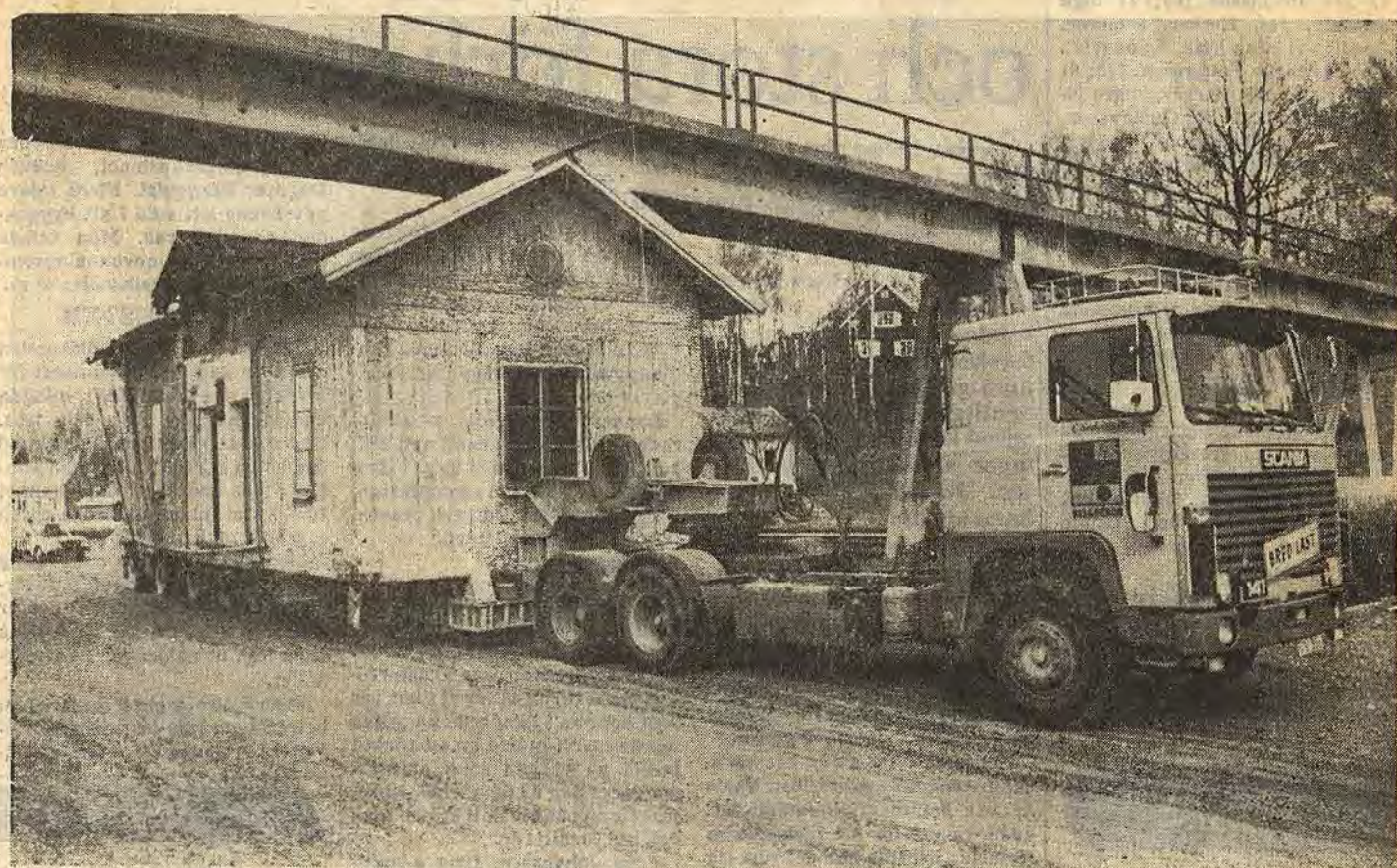
Det var nätt om utrymmet när man tog sig under gångbron. Marginalen var bara 10 centimeter