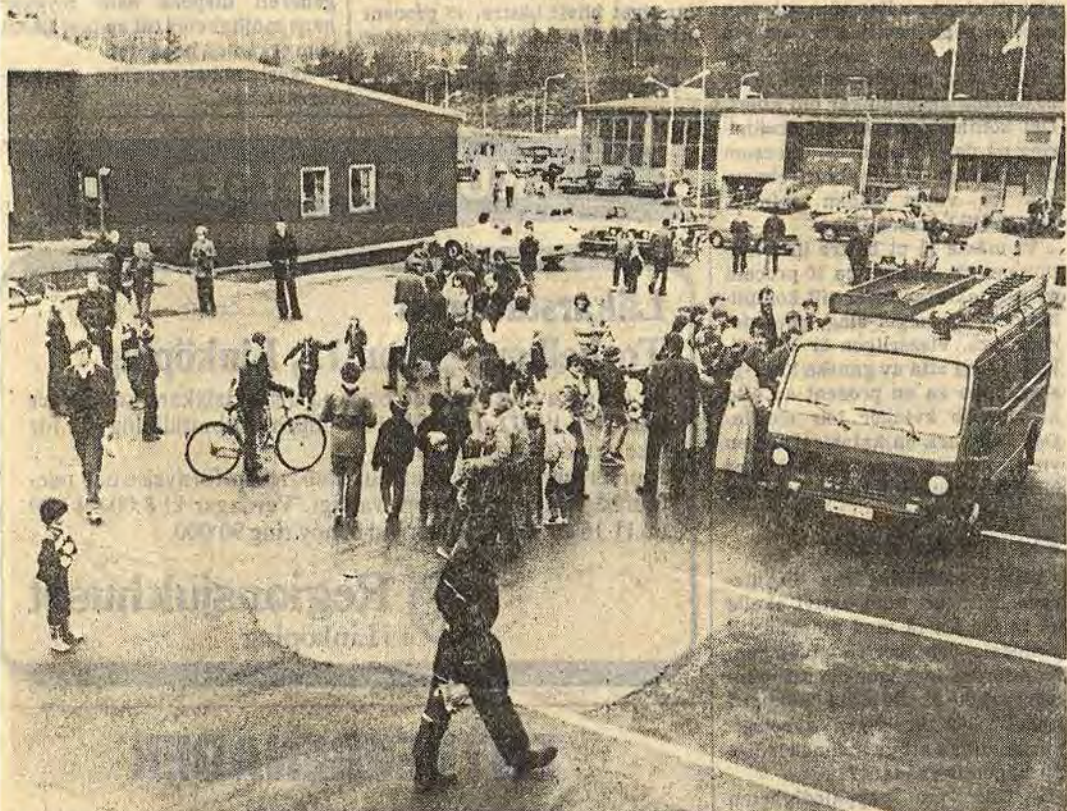
Stort intresse tilldrog sig brandförsvarets aktiviteter, särskilt av den yngre generationen, som dagen lång köade för att få åka brandbil med påslagna sirener och allt