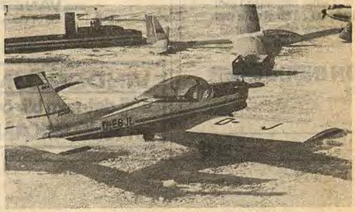
Ett 20-tal olika modellflygplan visades upp av Astrofly. Materialet till ett plan kostar ungefär 2 000 kr. Då är förstas arbetstiden inte inräknad. Att det kan ta upp till 200 timmar att knäpa ihop ett plan är ingen ovanlighet

plan i luften. Mest beundrades kanske Rune "Termik-Johan" Johanssons suveräna handlag med plan och radioapparat. Men så är också Rune Johansson från Norrköping ett begrepp inom