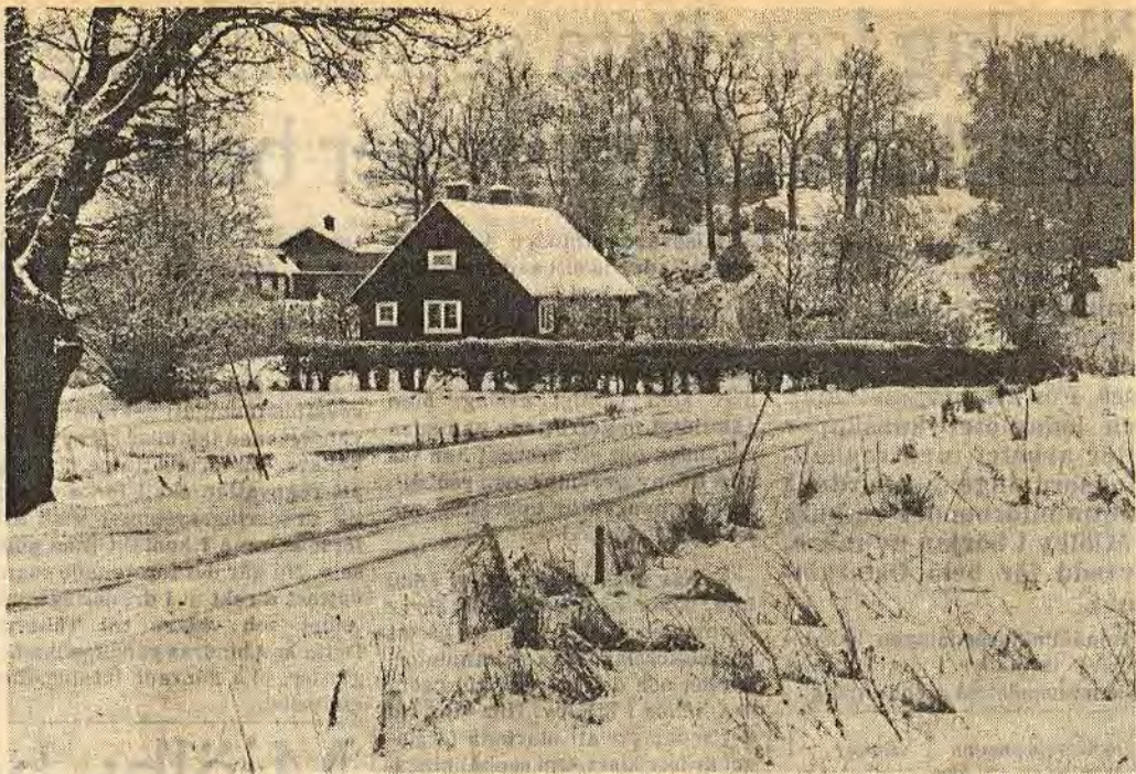
Utbyggnaden av bostadsområden i Åtvidaberg går vidare. Det är nu dags för nästa etapp av Basthagen utmed vägen till Mormorsgruvan. På andra sidan vägen ligger golfbanan. En del erinringar har lämnats in till byggnadsnämnden, bl a vad gäller Grindstugan. Byggnad och tomt ingick inte i köpet när kommunen förvärvade 98 ha mark av baroniet Adelswärd. Nu protesterar också baroniet mot planerade ingrepp mot Grindstugan