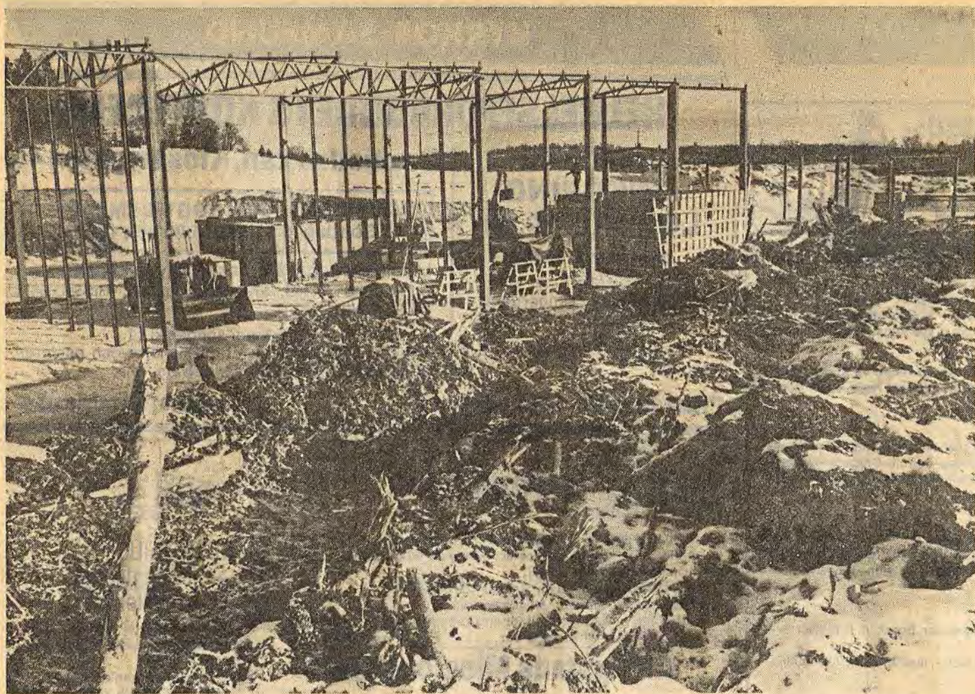
Ett av de nya företagen i Åtvidaberg är Åtvidabergs energiflis. På en 35 000 kvm stor tomt håller man som bäst på att bygga upp en av Sveriges största anläggningar för flisframställning. Investeringsvolymen ligger på drygt 5 miljoner kr. Men man hade att trassla sig igenom en ovanligt krånglig byråkratisk apparat innan företaget kunde komma igång — med fem banker, 17 remissinstanser, sex departement och två regeringar inblandade