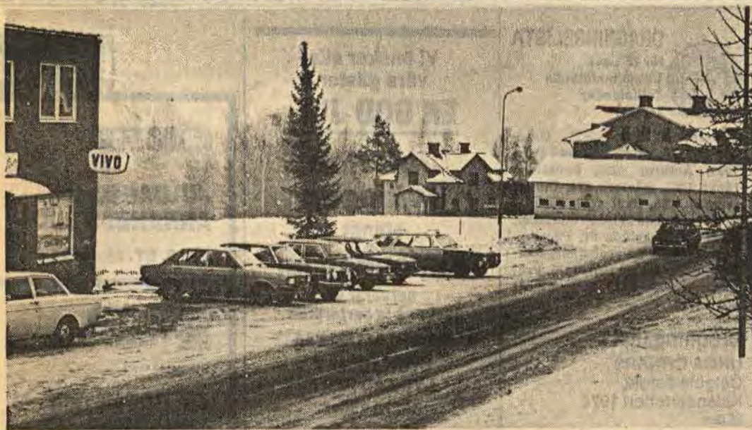
Ett 20-tal provborrningar i Falerum visar att det inte föreligger någon rasrisk för redan bebyggda områden. Däremot är det enligt den geotekniska undersökningen tveksamt om det sk Bankgärdet verkligen går att använda till servicebostäder i den omfattning som kommunen tänkt sig