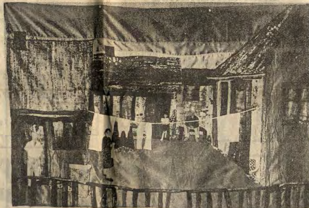
En gammal gårdsinteriör så som Gisela Eliasson berättar den med tyg, nål och tråd