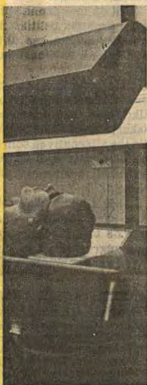
Reglerna för solarier skärps nästa år

Den andra kategorin är så kallade lysrörssolarier. För dessa krävs visserligen inget tillstånd men strålskyddsinstitutet rekommenderar ändå försiktighet vid användningen. Detta för att undvika bestrålning av personer som är överkänsliga för den ultravioletta strålningen. Ytterligare råd och anvisningar håller på att arbetas fram av myndigheterna. ■