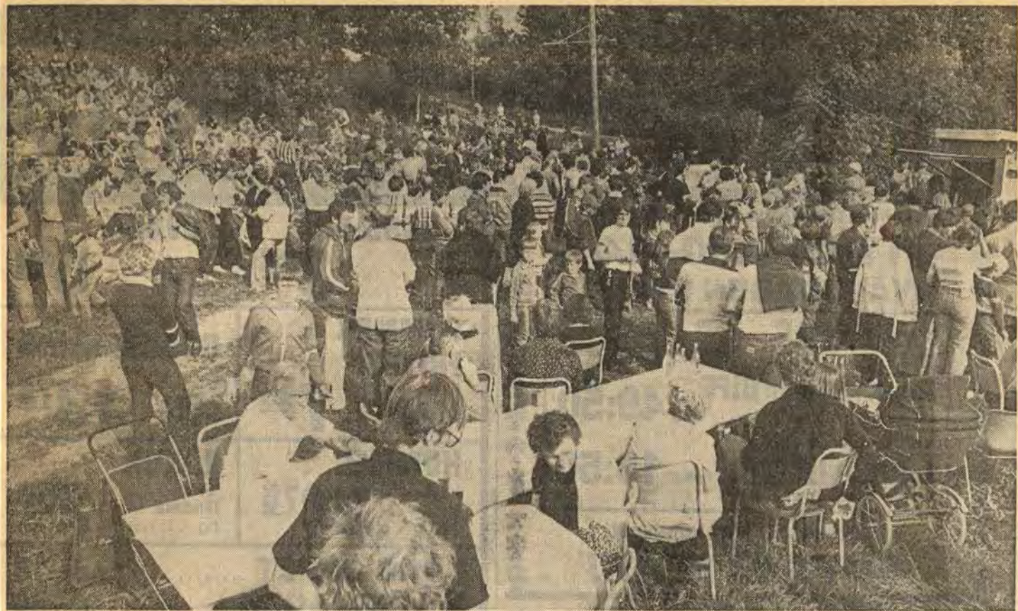
Åtvidabergarna är oftare ute i skog och mark än invånarna i andra tätorter. Det visar en undersökning som studenter vid skogshögskolan gjort. Bl a fann man att Åtvidsborna i åldern 16—70 år årligen gör nära en halv miljon besök i frilufts- och strövområden runt tätorten. I genomsnitt går åtvidabergaren ut i skog och mark 111 gånger per år. I undersökningar från andra orter har man fått fram siffran 92 besök per år