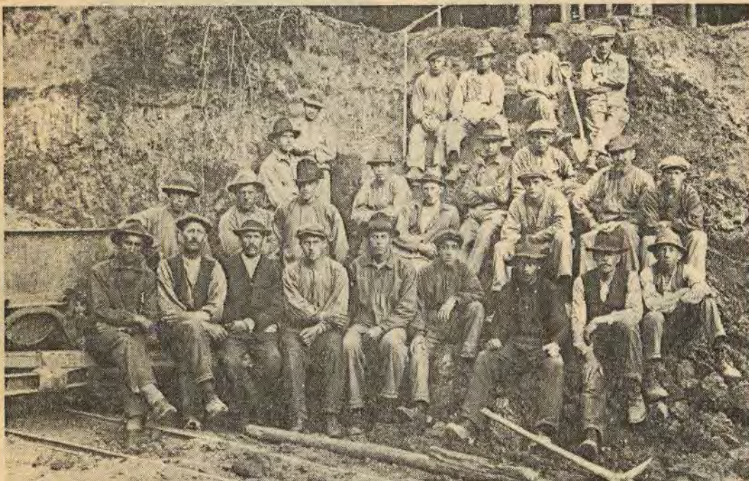
Tegelbruket i Falerum sysselsatte i början av seklet upp till 25 personer. Dvs bara där lika många arbetstillfällen som det finns anställda i hela Falerum i dag