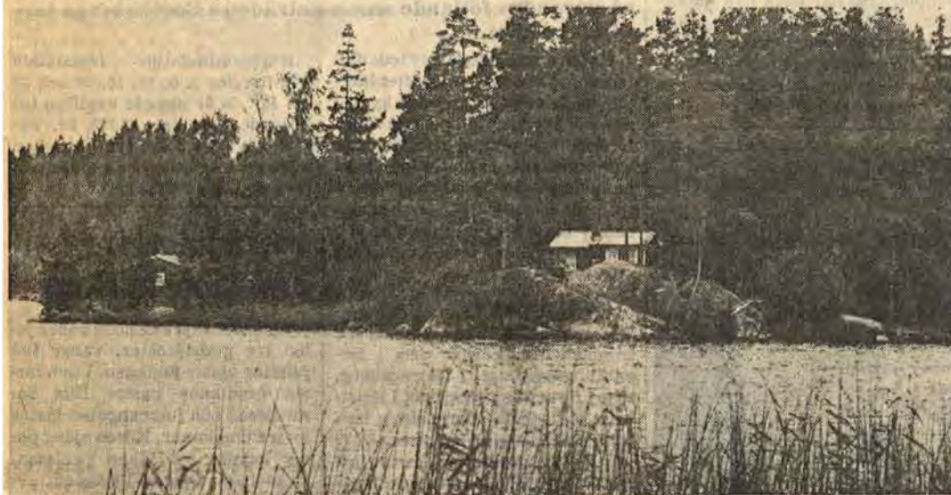
På ett område vid norra ändan av sjön Vin norr om Ätvidaberg vill fastighetsägare bygga 28 fritidshus. Förslaget har varit föremål för en hel del skrivelser och överklaganden. Länsstyrelsen har nu fastställt planförslaget. Man har beslutat begränsa utbyggnaden till 20 hus med hänvisning till vissa naturvärden

Länsstyrelsen har nu avgjort det omstridda förslaget till byggnadsplan för ett mindre fritidshusområde vid sjön Vin en mil norr om Ätvidaberg. Omstritt på det viset att förslaget gett upphov till anmärkningar, överklaganden, en JO-anmälan och att Ätvids naturvårdssakkunnige för drygt ett år sedan lämnade sitt uppdrag. Länsstyrelsen har beslutat begränsa den föreslagna exploateringen med åtta tomter till tjugo.