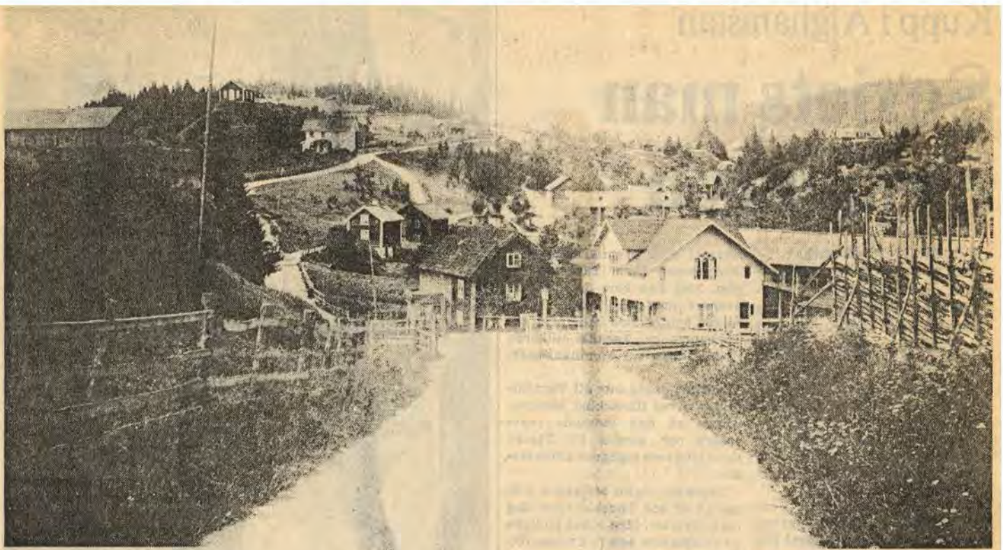
Del av Falerum i början av seklet. Det vita huset närmast kallas Börsen och var affär till början av 70-talet. Längst upp till vänster på en kulle ligger ett litet hus. Där står nu Ordenshuset

Efter hans död lades alla fotografier, alla hundratals och åter hundratals glasplåtar tillsammans med negativ och fotografisk utrustning åt sidan. Och föll i glömska.