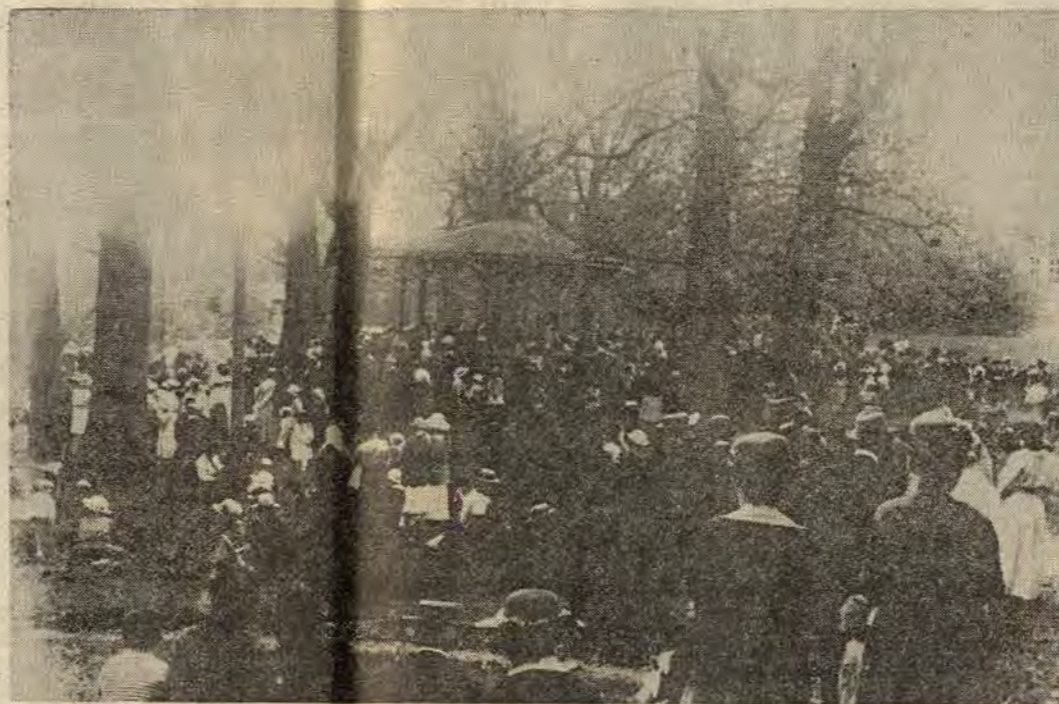
"När solen gick ner så var Klockarängen förvandlad till en festplats där ockupanterna firade sin seger"

Polischefen fick en fin idé och kommanderade ner tre poliser med var sin motorsåg och grodmansdräkt i kanalen för att göra