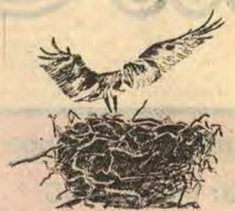
I hela Sverige finns i dag ca 2 000 häckande fiskgusar. Sverige har goda häckningsförhållanden. Fågeln är känslig för störningar från t.ex. kanoister och fritidsfiskare. Fiskgusen finns representerad i Åtvidaberg såväl som i rådet att göra boken så omfattande som jag ville ha den. Ett förslag ville t.ex. ta bort nästan all text och ungefär halva bildmaterialet.

Visserligen ägde förhandlingar rum med några olika förlag. Men, förklarar Olof Söderbäck, ingen