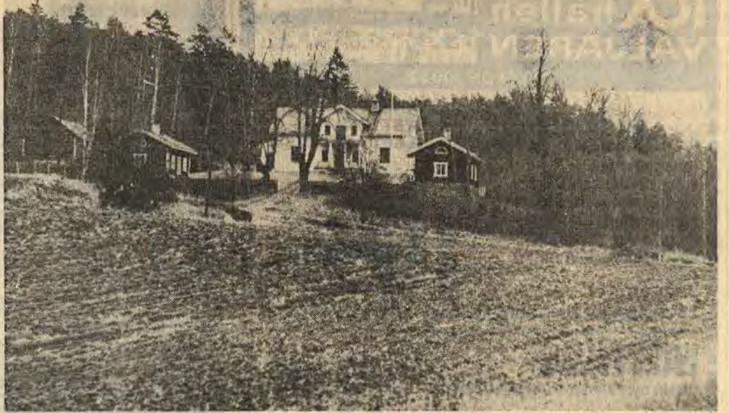
Prästgården i Yxnerum, ett par mil från Åtvidaberg, såldes vid en auktion på lördagen i en fullsatt församlingssal. Slutbudet blev 560 000 kr, fast då får man förstås en rätt välskött prästgård och ca 4 500 kvm mark med idylliskt läge