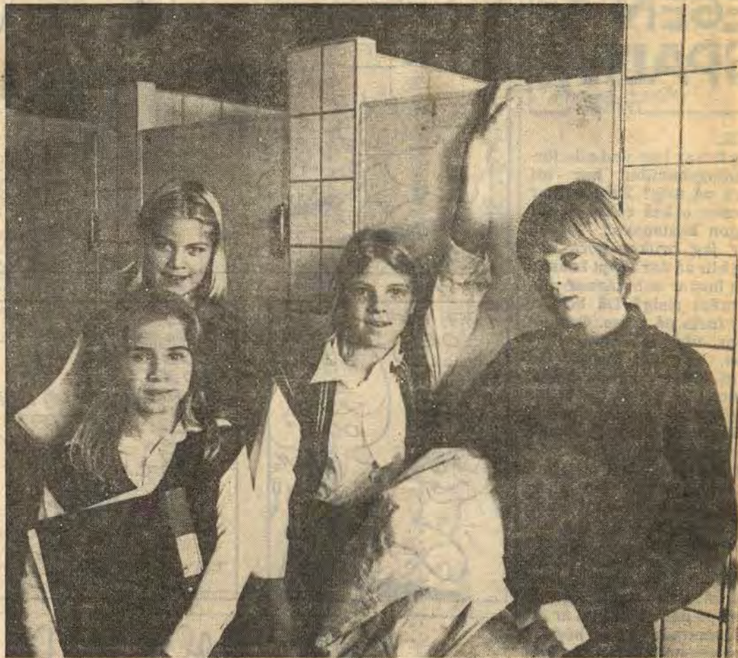
Skolrådet har nu skickat ett brev till politikerna i Åtvidaberg med begäran om att toalettväggarna i skolan ska gå ända upp i taket. För nu är det en del som busar här. Låser inifrån och klättrar upp sedan. Eller klättrar upp och tittar på den som är på toaletten