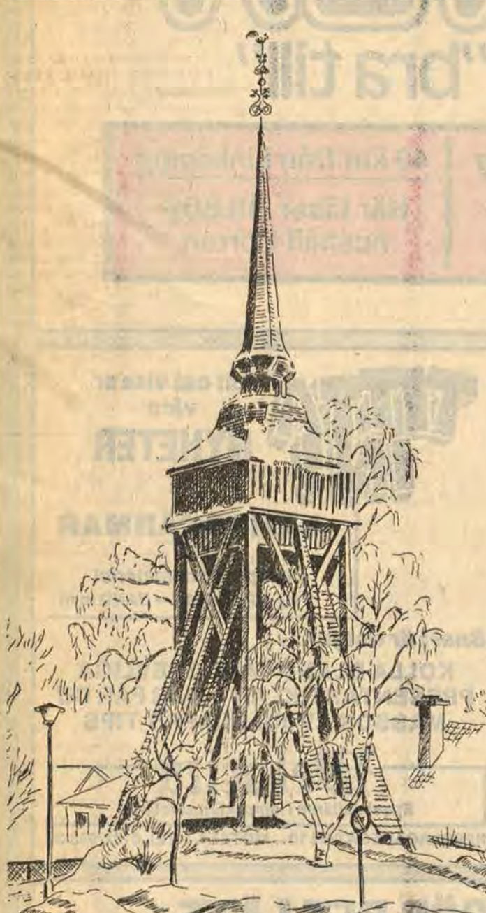
Klockstapeln i Åtvid är mer än 200 år gammal. Olof Söderbäck vet att berättat att det var nära att klockstapeln förstörts i väg till Skansen. Men när Åtvids stora kyrka byggdes i slutet av 1800-talet så uppfördes den i sten och då blev trycket på tornmurarna så stort att man drog sig för att placera klockorna uppe i tornet. Denna tvekan blev räddningen för klockstapeln.

— Över 20 lyckliga år har jag tillbringat här i Åtvidaberg. En kommun som helt fångat mig, gjort mig till en av de sina och kommit att bli mina barns uppväxtmiljö och hembygd. Men förändringens vind blåser stark och stundom har jag känt ett behov av att släppa tidens flykt, att på något sätt bevara nuet åt framtiden.