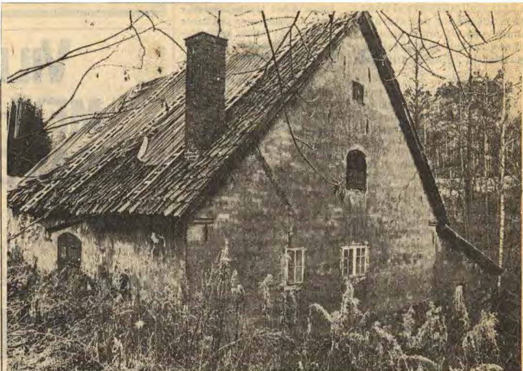
Som synes på bilden är 1700-talskvarnen i Forsaström någon mil öster om Åtvidaberg i allt annat än önskvärt skick. Kulturvårdande på lokal- och länsnivå vill ha kvar kvarnen. Ägaren Forsaströms kraftaktiebolag vill riva den. Om inte någon åtar sig underhållskostanderna. Eller om kommunen köper byggnaden för 1 krona