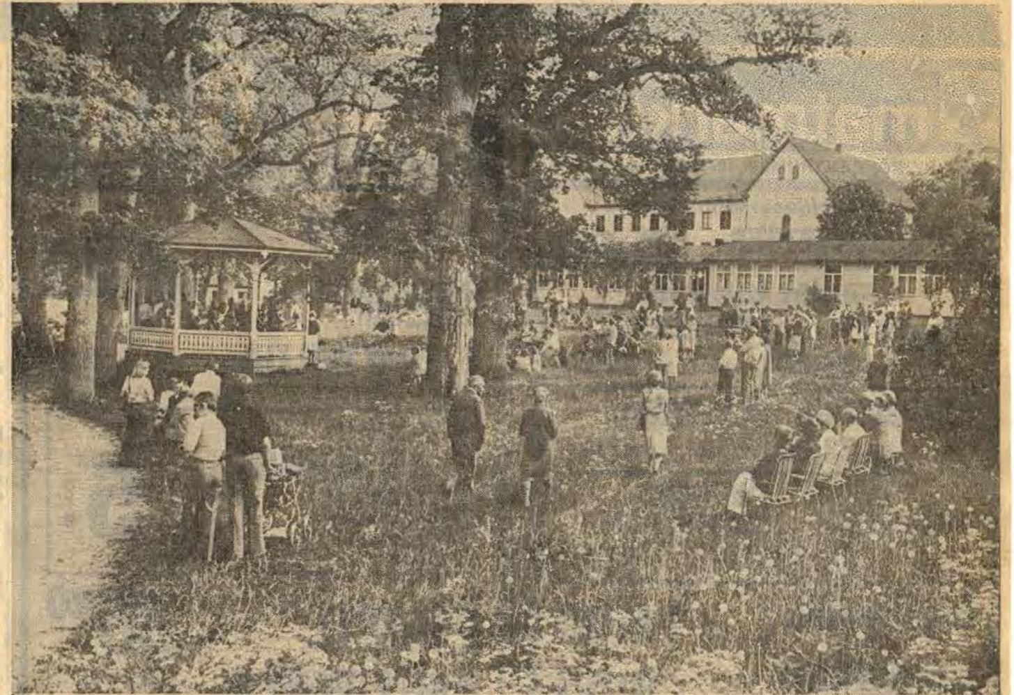
Det här är en del av Klockarängen i Åtvidaberg. Det idylliska och traditionsrika grönområdet ligger mitt i samhället mellan Åtvids gamla kyrka och

Slevringevägen tangerar i dag Klockarängen, stiger brant i en backe där skolan med 500 låg- och