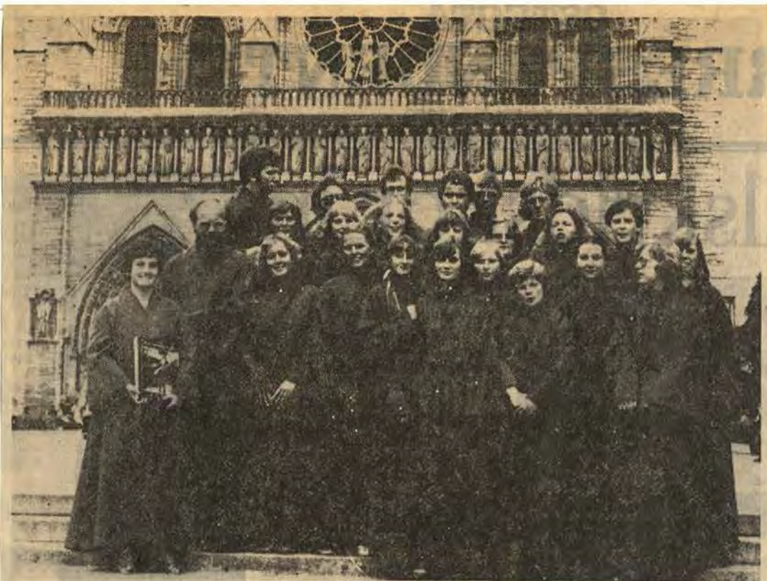
I somras gjorde Åtvids församlings ungdomskör en resa till Frankrike och sjöng bl a i Notre Dame (bilden) inför ungefär 2 000 personer. Resan blev dyr och man försökte på alla sätt samla in pengar. Bl a av kommunfullmäktige, som häromdagen efter lång diskussion avslog ansökan med motiveringen att kyrkan får klara sina egna angelägenheter själv