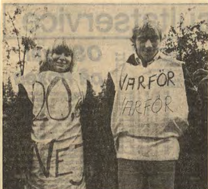
Egentligen borde vi klätt oss i säck och aska men det här får duga, menade två unga hyresdemonstranter