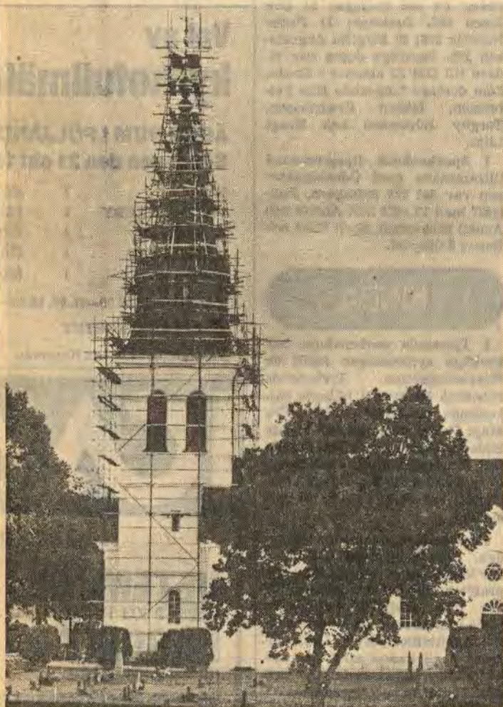
Den yttre renoveringen av Hannäs kyrka har påbörjats. Kostnaderna blir höga. Hittills har man räknat fram utgifter på över 400 000 kr och en skatthöjning tycks oundviklig för Hannäsborna