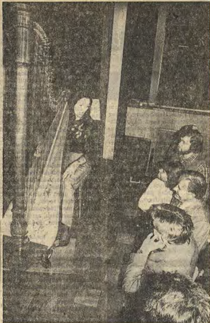
Åtvidabergsborna hade på söndagen tillfälle att njuta till harpospel vid en konsert med Gertrud Schneider

Inbrott i bilar. Under veckosluttet begicks inbrott i två bilar parkerade vid Gulf. Tjuvarna tog med sig bandspelare, batterier och däck till ett värde av sammanlagt 2 000 kr.