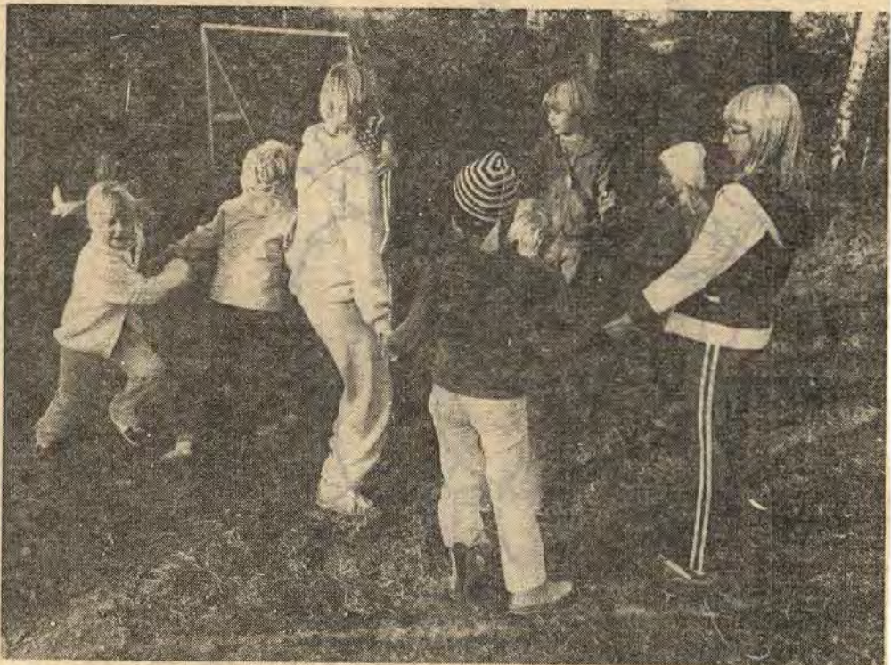
Innan man går hem avslutas varje träff med lekar. Här leker man Knack, knack, är Mulle hemma