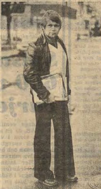
När Åtvidaberg fick sin egen "energimiljoner" var kommunen en av de första i landet att inrätta specialisttjänsten

De tre anläggningarna har undersökts noga i alla vinklar och vrår. Man har studerat ventilationen, skärskådat sanitetsgrejerna osv. Sedan ingenjör och konsult funderat och räknat presenterades ett åtgärdsprogram för dryga miljonen. Plus en