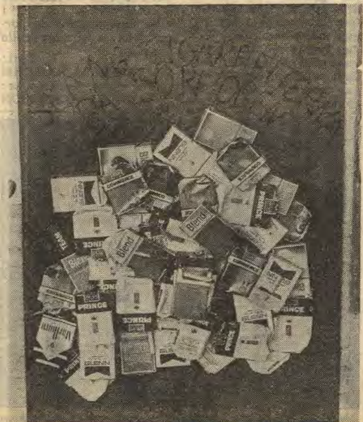
Släng cigaretterna på sophögen står det på det här montaget med en massa cigarettpaket