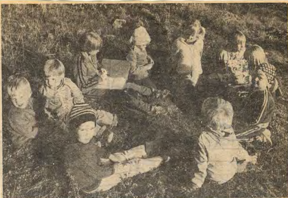
Innan Skogsklubben börjar dagens övningar slår man sig ner på marken och pratar om vad som ska göras. Ibland frågar också ledarna litet om det man gjorde förra gången