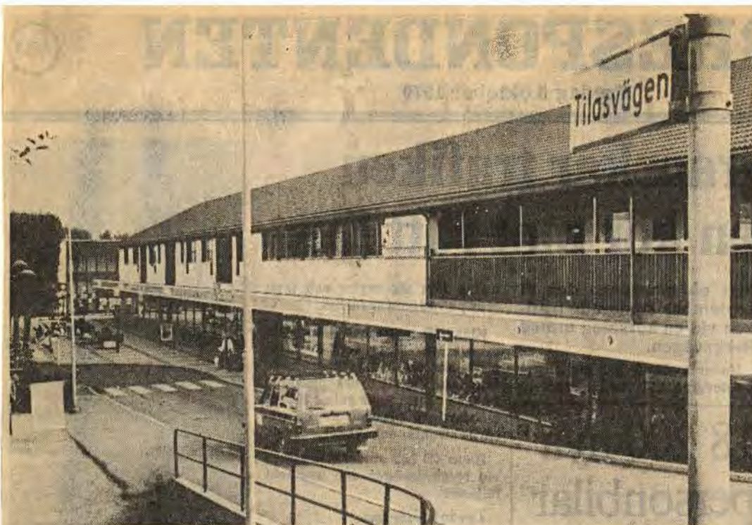
I början av 70-talet fanns det fem möjligheter att ta sig till Stortorget. I dag finns det tre tillfarter. Framöver kommer man bara att kunna nå torget via Tilavsvägen vid polisstationen