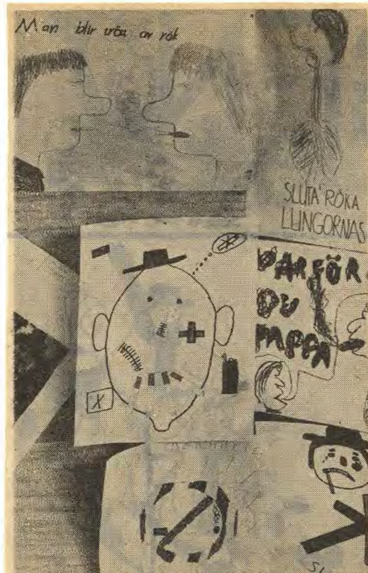
Det fanns massor av teckningar i foajén. Alla visade de hur läbbigt det är att röka