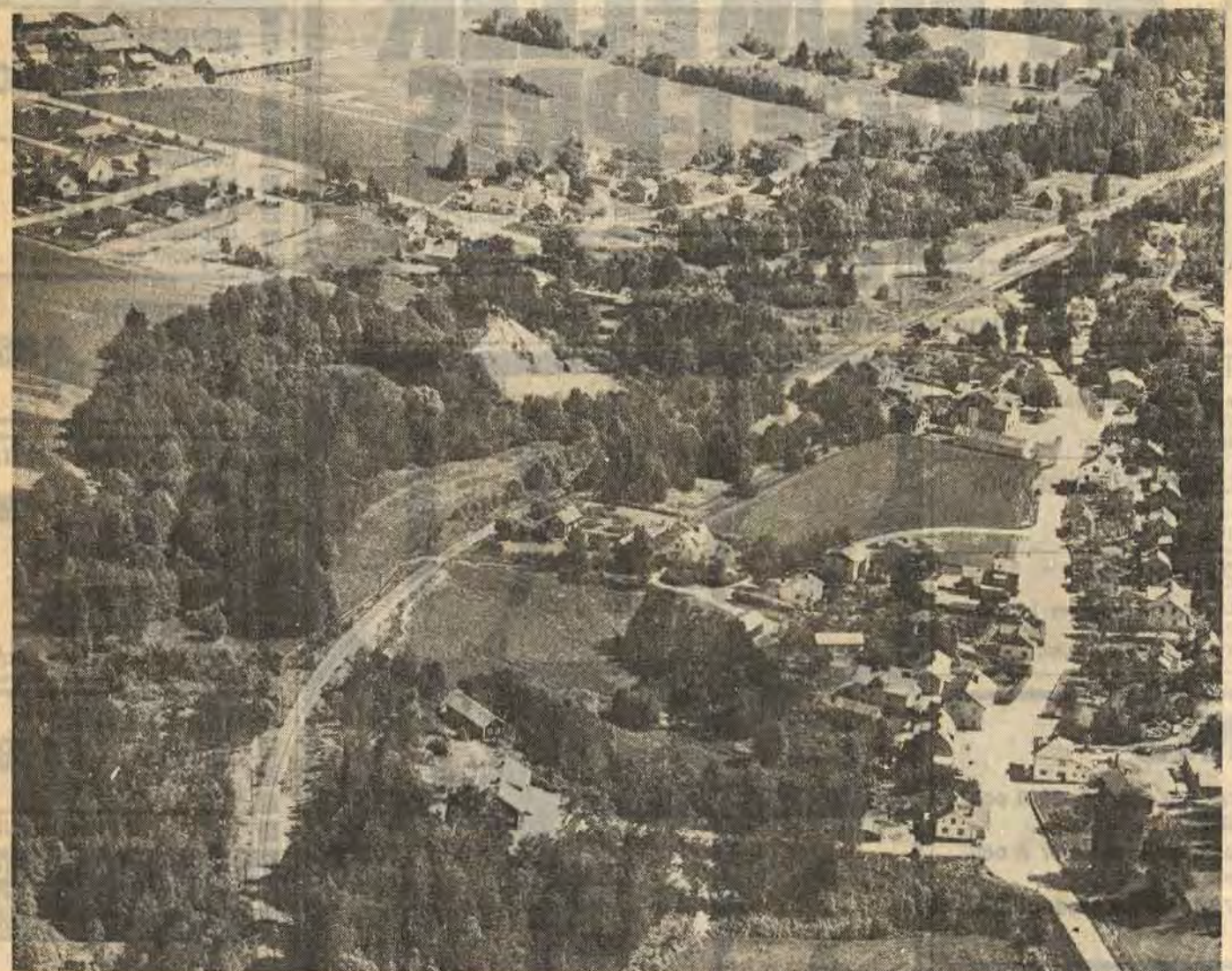
Falerum är inget övet samhälle att bo i, men byggandet av planerade servicebostäder får anstå ett tag ty länsstyrelsen vill att man grundligt ska utreda markförhållandena först så att inte husen glider iväg. Förresten är Ortsbefolkningen inte överens om var husen ska byggas

Frågan om var servicebostäderna i Falerum ska byggas kommer troligen inte alls att avgöras vid kommunstyrelsens sammanträde på måndagen. Kommunstyrelsens planeringsutskott beslöt nämligen på onsdagen att rekommendera en bordläggning av ärendet. Ett ärende som inte bara gäller servicebostäderna utan hela områdesplanen för Falerums tätort med dess planerade skolbygge, bostäder och industri och hantverk.