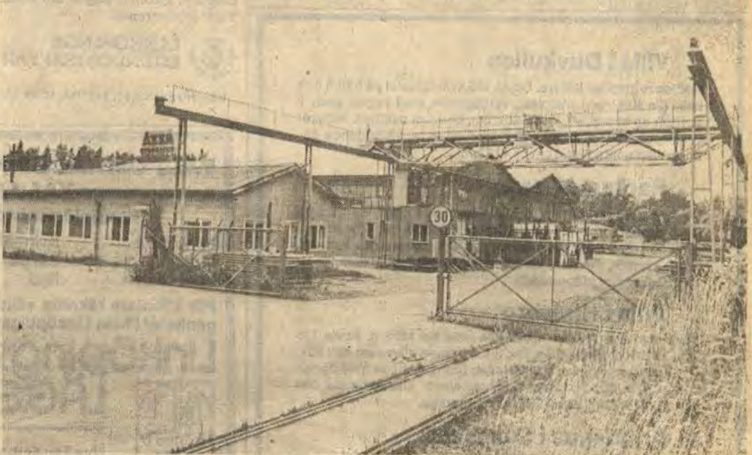
ÅSSA koncentrerar sin verksamhet och avvecklar stålhusstillverkningen i sin B-fabrik. Här jobbar just nu omkring 20 personer. Det kommunala bolaget Ätvidabergs industribyggen är berett att köpa fabriken för 1,5 milj kr. Förhandlingar pågår med ett företag i Kiruna om överlåtelse av produktionen