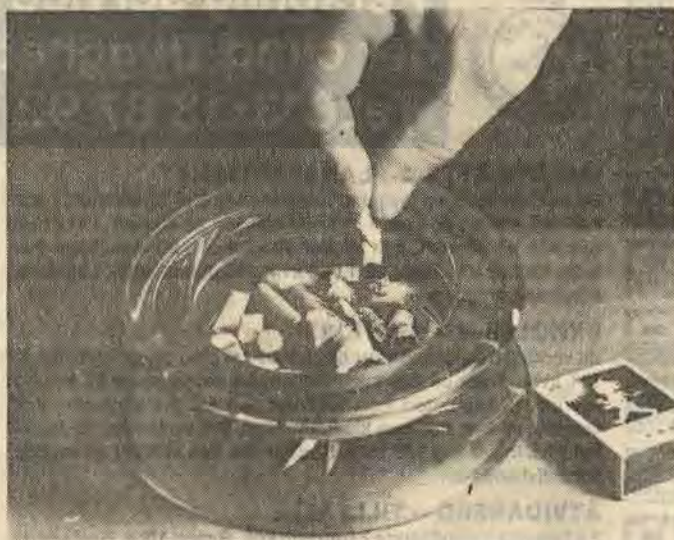
Så här ska askkopparna inte se ut i Åtvid i fortsättningen

En sådan här kampanj blir förstås väldigt dyr?