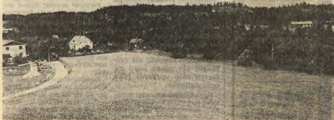
Det här är "bankgärdet" i Falerum. Här bör servicebostäderna för äldre byggas. Det tycker i varje fall Falerumsborna själva och många med dem

Byggnaderna placeras på ett begränsat område där det också finns en gemensamhetsbyggnad. Där ska det finnas matsal, kafforium, bad, terapilokaler, rum för fot- och hårvård, bibliotek osv. Den som vill klara sig själv kan göra det i sin egen lägenhet. Andra kan utnyttja de serviceanordningar som finns.