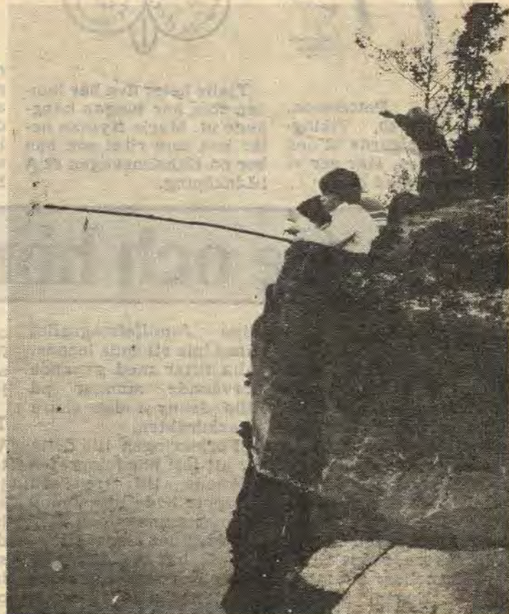
Klockan är tre på morgonen. Det är då som det nappar bäst. Det försäkrade alla barnen som var med på övernattninng. Om det är sanning eller om det bara var ett knep att väcka ledarna är just frågan