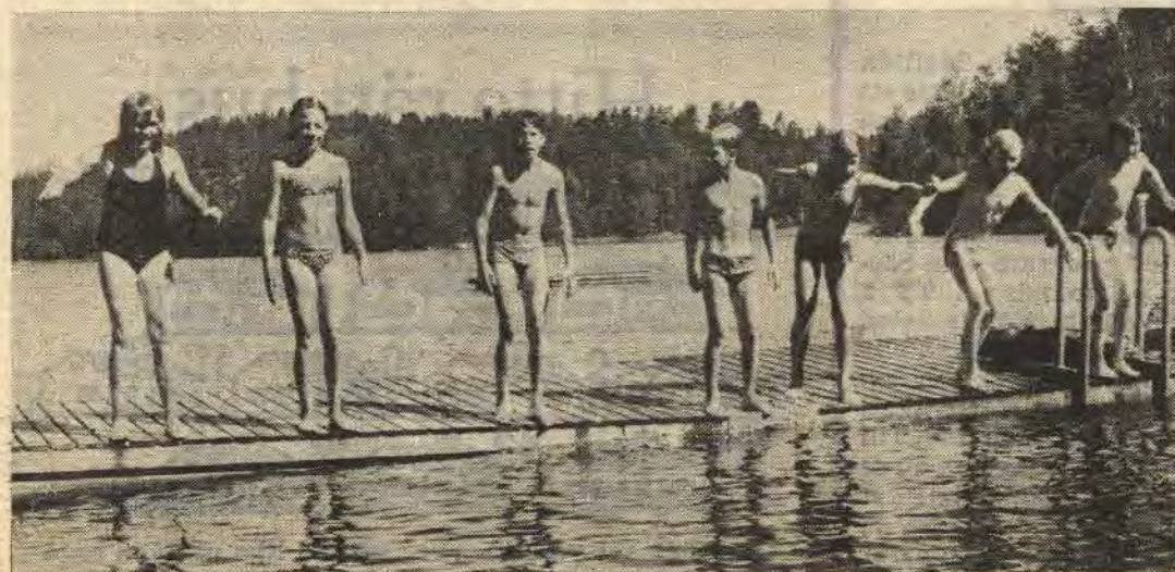
Är det badresor så är det. Barnen som var med på årets badresor till Domarvik hade oftast varmt och härligt badvatten