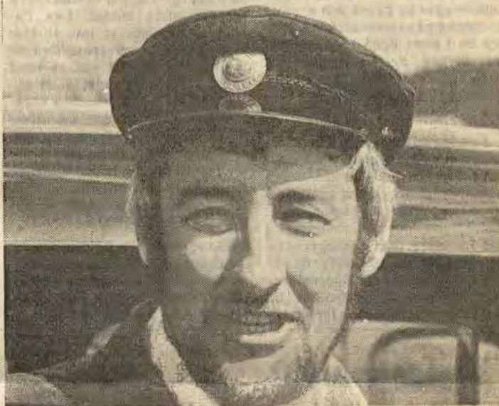
Har man en droska så hör det förstas till att man har en äkta gammal droska chaufförmössa