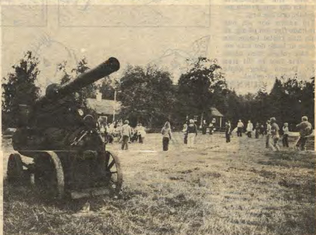
Det här är Domarvik i Hannäs dit en massa barn under tre veckor får åka på badresor. På den här ängen spelas varje år en viktig fotbollsmatch mellan barn och vuxna. På ena kanten står en gammal, gammal lokomobil. Det är inte en kanon från 1800-talet, om någon trodde det