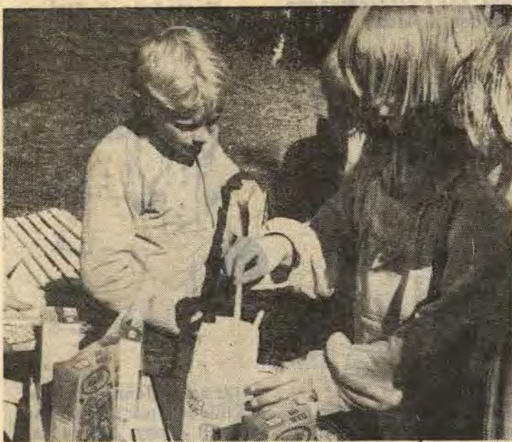
Efter en fnissig natt och en uppfriskande fisketur smakar det förstas gott med frukost