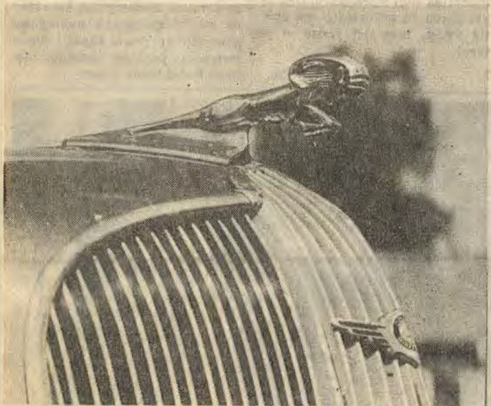
Kylarmaskot på Dodge modell -36