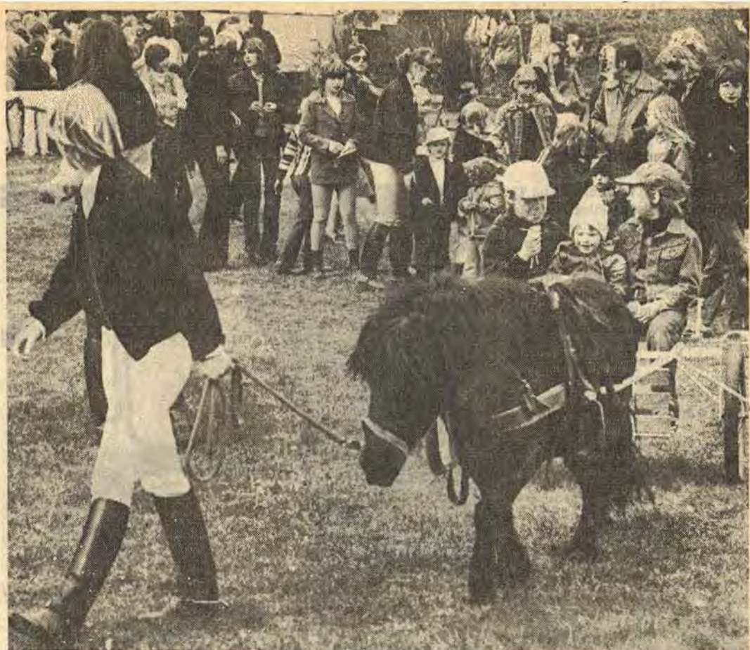
Att få åka i vagn efter en liten shetlandsponny tillhörde de mest populära aktiviteterna bland de yngre under den stora familjefesten i Folkparken i Åtvidaberg