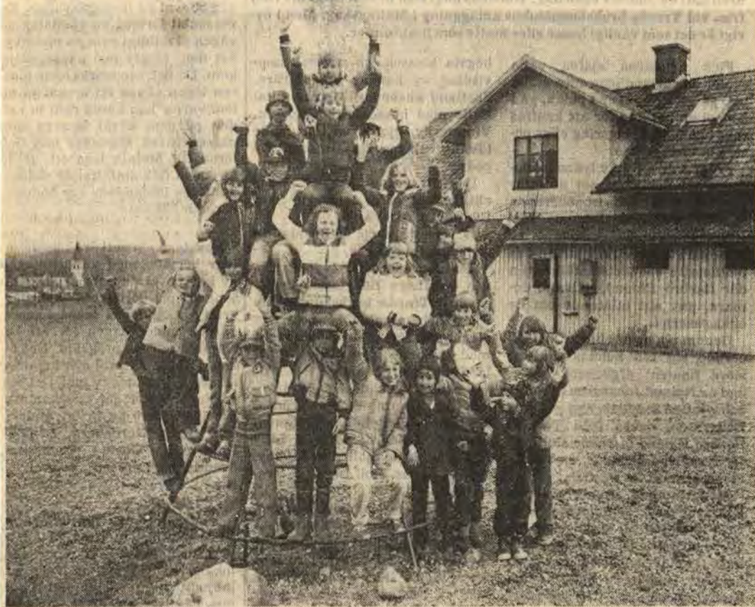
Fredriksbergs skola i Hannäs är den sista i bruk varande skolan i församlingen. Där går i dag 31 elever på låg- och mellanstadiet och 13 barn i deltidsskolan. Befolkningen har fått löfte att skolan får vara kvar så länge det finns minst sju elever i varje klass. Men en ny skola ska byggas i Falerum en mil längre bort. Ska skolan i Hannäs offras för att man ska få tillräckligt elevunderlag i Falerum frågar sig oroliga föräldrar

— Vi är övertygade om att byggs det en skola i Falerum måste barnen från Hannäs till för att fylla den skolan. Men vi ger aldrig upp kravet på en för-, låg- och mellanstadieskola i Hannäs så länge vi har ett godtagbart elevunderlag.