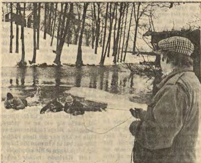
En efter en, och inte utan ett visst dödsförakt, plumsade badmästare och annan simhallspersonal i Bysjön i Åtvidaberg. I fortsättningen har de nog lättare att lära ut isvett