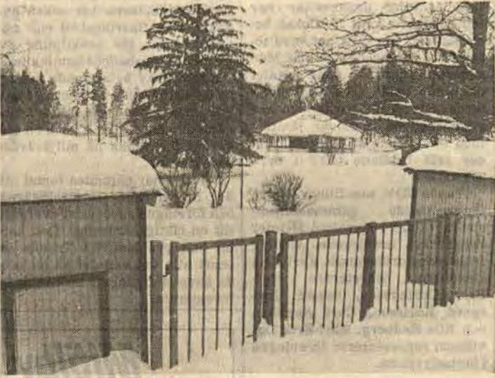
Fritidsnämnden i Åtvid vill investera ungefär 4 miljoner på fritiden i Åtvidaberg under åren 1979—83. Bl a vill man satsa på att göra Folkparken i Åtvidaberg levande genom att anlägga en minigolfbana för 100 000 kr och en utomhusscen och en servering för 125 000 kr. De senaste åren har Folkparken utnyttjats 5—10 gånger om året

I sporthallen vill man göra anläggningen mer handikappvänlig