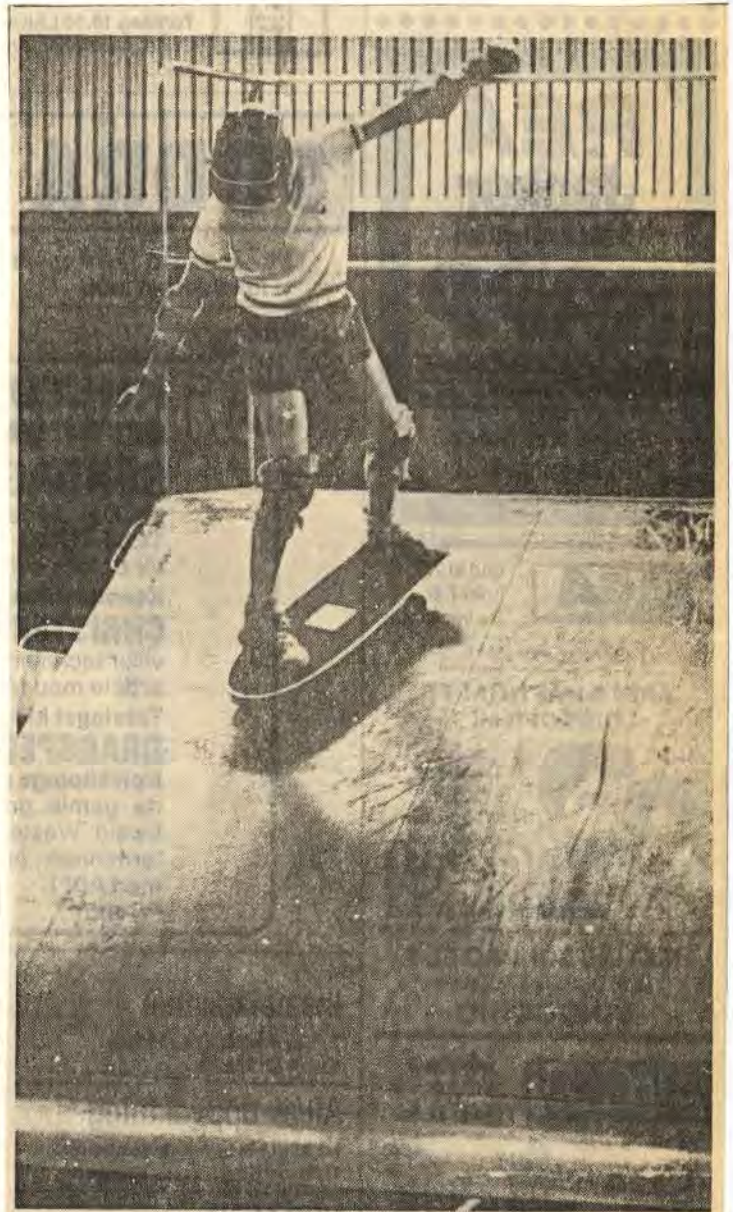
De anställda på sporthallen har själva tillverkat en "nödvändig" ramp åt åkarna

Många rivna rådjur. I trakten kring Borkhult har män under de senaste dagarna hittat ett tiotal rivna rådjur. Jägare i trakten har själva fått avliva flera djur och polisen i Åtvidaberg har i ett par omgångar varit i Borkhult för att spåra skadade rådjur. Pimpelfiskare och andra har varit åsyna vittne till hur rävar jagat ifatt och rivit rådjur. Man är tämligen säker på att det är räven som varit framme i de flesta fall. För rådjuren handlar det om en plågsam död eftersom räven inte dödar så stort byte först utan bitar av kött från bakdelen. Försök har gjorts att utfodra räv med slaktavfall men den tycks just nu i kyla och djup snö finna behag i att skaffa sig föda på annat sätt.