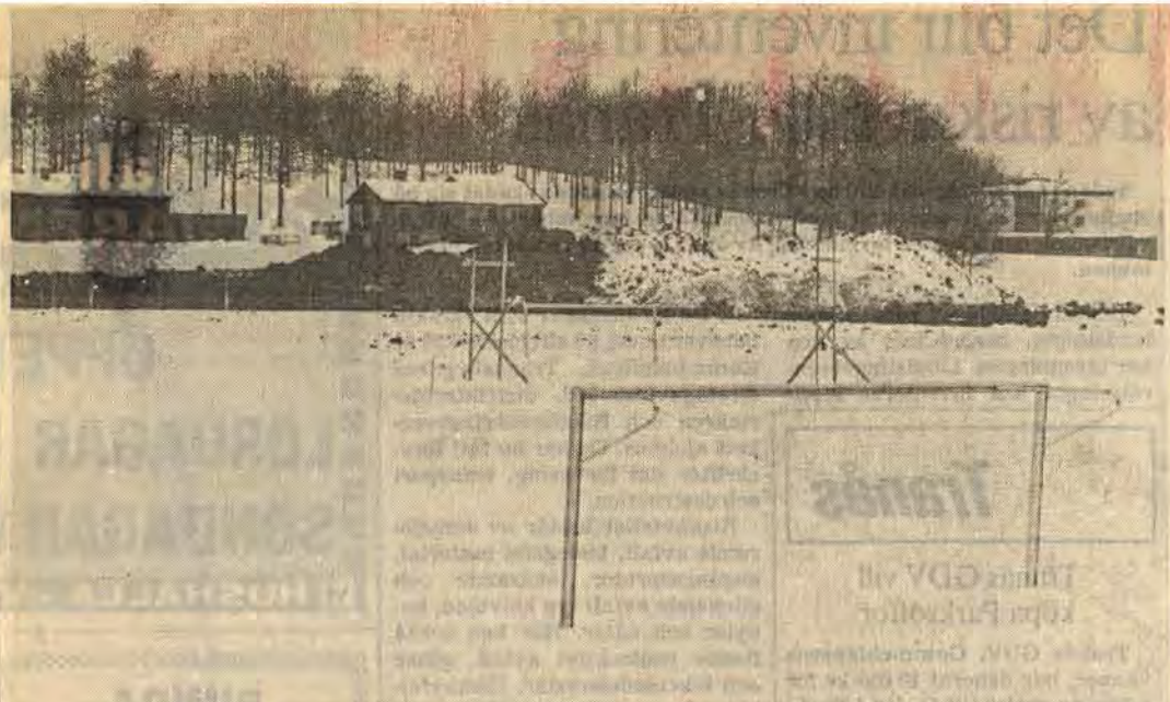
I fritidsnämndens förslag till långtidsbudget ingår utbyggnaden av Edbergafältet till ett sportfält. Arbetet har redan kommit igång och beräknas i år uppgå till en halv miljon. Lika mycket vill man satsa på fridrottsanordningar på Edberga 1981