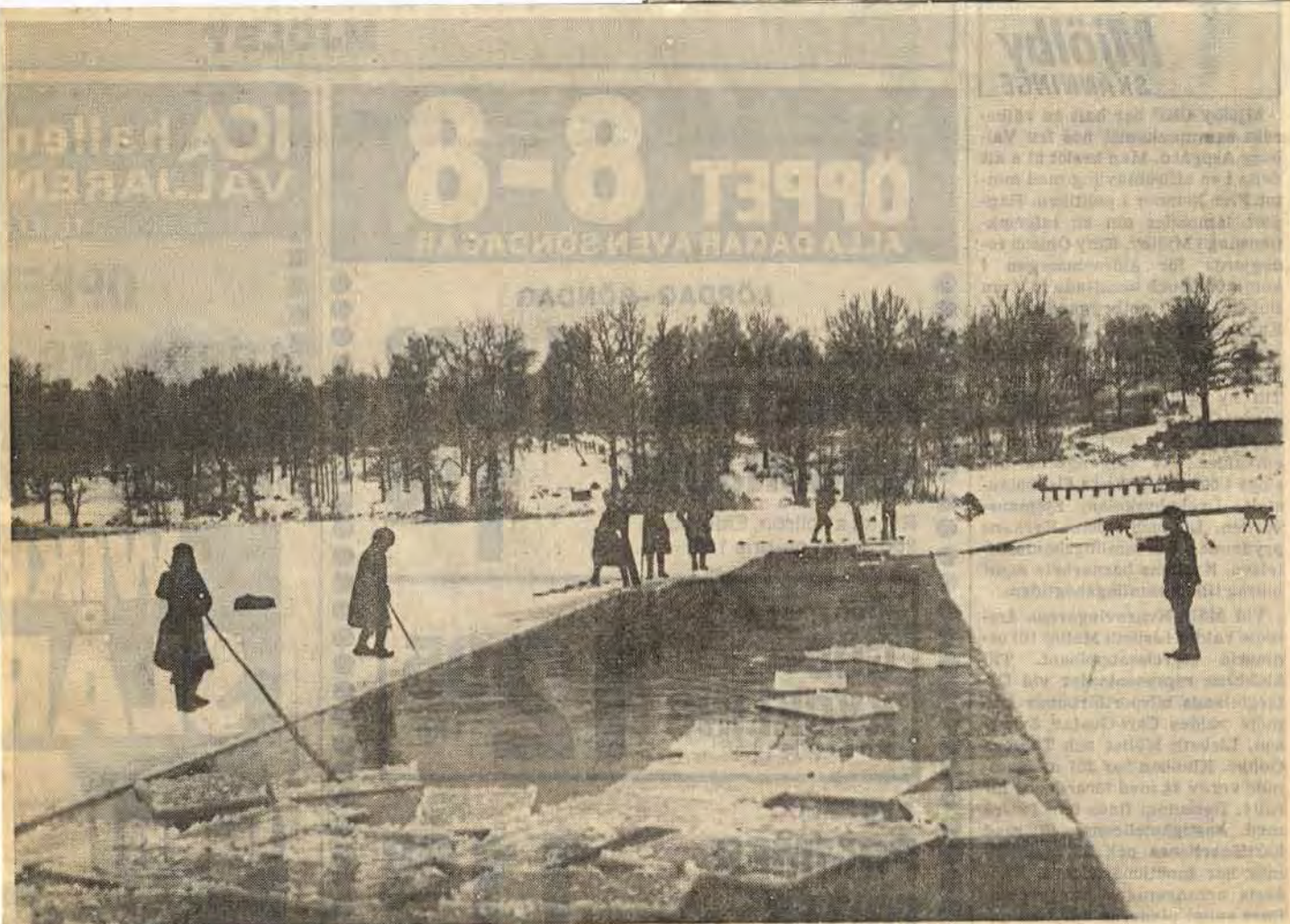
IS TILL PUNSCHEN? Nåja. Det är väl tveksamt om något av den här isen gick till punschkylning. I varje fall inte mycket. Bilden är tagen på Bysjön vid Ätvidaberg år 1903 av Ätvidabergsfotografen Johan E Thorin. På andra bilder syns det att de rektangulärt sågade isflaken är halvmeter tjocka. Så småningom drogs de upp vid plankan längst bort och lastades på hästdragna kärror. För att slutligen hamna djupt inbäddade i sågspån i stora isdösar. I ordentligt packade dösar kunde isen hålla sig åtminstone över sommaren.