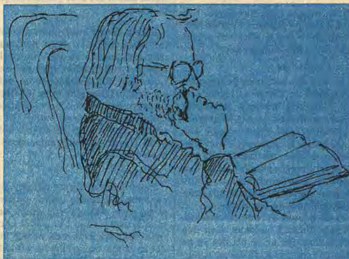
Bakom en stilla, närmast försynt och lågmäld fasad döljer sig temperament, envishet, intelligens, känslighet, fnissighet och djävulskap i lagom proportioner

Kantorn i Åtvid föddes som det femte av sex syskon en försommardag 1940 i Voxtorps socken i mörkaste Småland. Han kom till världen med bred panna och nyfiken blick. Så småningom blev hårfästet högre, lockarna och skägget alltmer ostyrt och glasögon måste anskaffas.