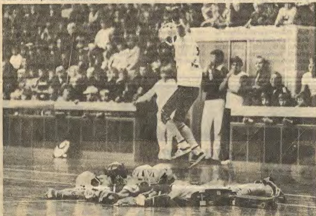
Åtvidabergs skateboardklubb svarade för ett bejublat uppträdande när man inför en fullsatt sporthall presenterade sin sport. Klubben har bara varit i gång ett par månader. Ändå har man hunnit öva upp stor skicklighet. Eller vad sägs om längdhopp över levande föremål och ner på en annan väntande rullbräda.