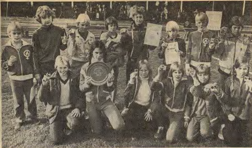
Det här är skolmästarna i årets "landskamp" mellan Långbrottsskolan och Centralskolan i Åtvidaberg. Långbrott tog flest individuella segrar medan Centralskolan tog hem slutsegern och därmed sin andra inteckning i Correspondentens vandringspris