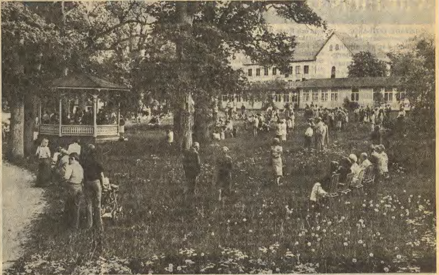
Det här är Klockarängen i Åtvidaberg. Grönområdet ligger mitt i samhället mellan Åtvids gamla kyrka och Kopparvallen. Klockarängen har i generationer varit en samlingsplats för invånarna i Åtvid. Musikkpaviljongen är byggd 1870. Ekarna är flera hundra år gamla. I samband med arbetet med en trafikledsplan för Åtvid diskuteras en trafikled genom ängen. Nu har över 5 000 människor skrivit på listor för Klockarängens bevarande

Det råder inte längre någon tvekan om att åtvidabergarna vill ha kvar sin idylliska och traditionsrika Klockaräng i orört skick. Att man säger ett bestämt nej till planerna på att dra en trafikled genom grönområdet. Under knappt tre veckor har namnlistor cirkulerat i Åtvidaberg på arbetsplatser, i affärer och i bostadsområden. På fredagskvällen gjorde aktionsgruppen för Klockarängens bevarande en första sammanräkning av listorna. Resultatet talar för sig själv. Över 5 000 namnunderskrifter har man fått in. Då saknas ändå ett 60-tal listor så siffran kan stiga ytterligare.