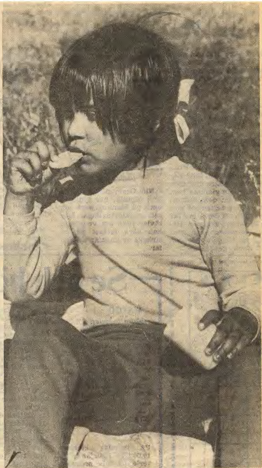
Mums, sa Sara. Det bästa med sådana här tavlingar är nog ändå rasterna