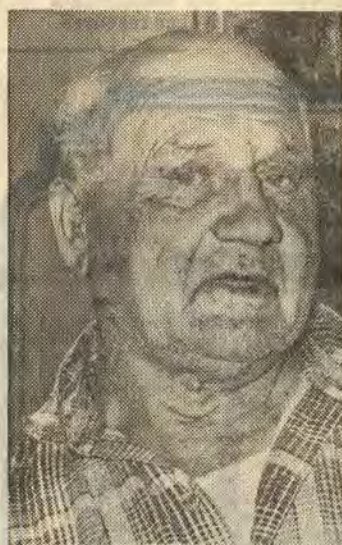
Jag skulle nog ha passat som polarhund