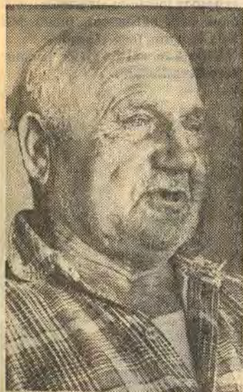
Alla borde göra som jag, dvs skriva ner sina minnen

svenska snusproduktionen har under årens lopp försatt sin ägare i många situationer. Ofta delikata sådana. Men det får en stå ut med, säger han och det glimmar av illmarighet i de pigga blå ögonen.