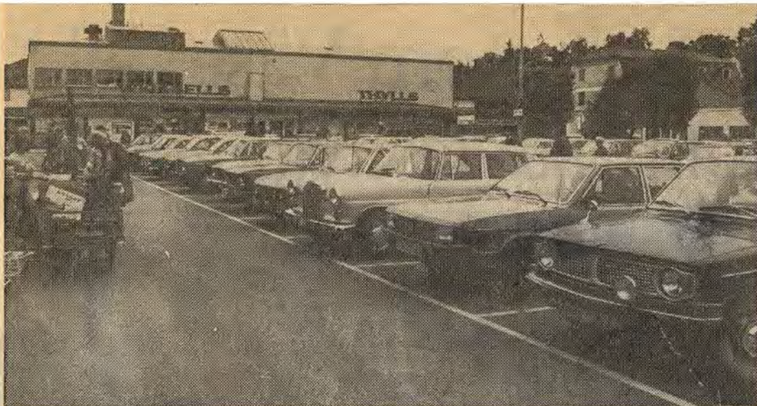
En hel rad med felparkerare. Fast troligen är det ingen som vet om det för skylten står på en sådan plats att man knappt lägger märke till den. Polisen ser mellan fingrarna och trafiknämnden ska se över saken