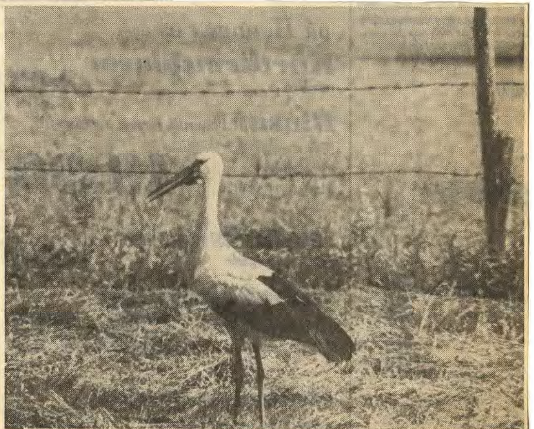
Storken Tore lyfte först när fotografen kommit på 15—20 meters avstånd