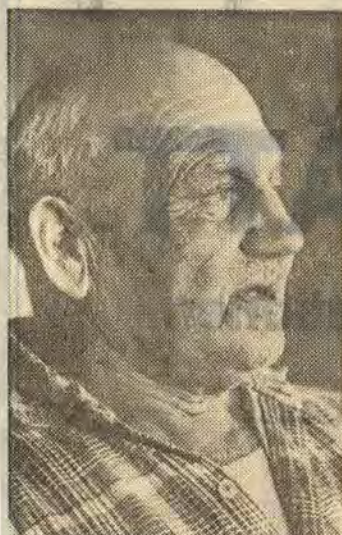
Strunta i grammatiken. Huvudsaken är att man gör sig förstådd

Wiklund låter oss tjuvläsa lite i korrekturet och pekar med sin stora näve ut olika partier. Det är skildringen från barnhemmet i Stockholm. Hur han som nio-åring skickades till fosterhem i Ukna och fick lära sig jobba som satan för brödfödan. Men jag tycker om tungt arbete, säger han. Jag skulle nog passat som polarhund.