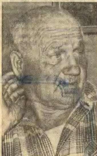
Skriver jag en bok till så blir det en om bara politik

nalpamp i Åtvid har blivit trampad på tårna. I färskt minne har man turerna kring tillsättandet av en näringslivskonsulent och hur sotaremästaren besvärade sig ända upp till regeringsrätten. Men det skriver han inte om i sin bok. Det var en alltför obetydlig händelse för att slösa tid och papper på, säger han.