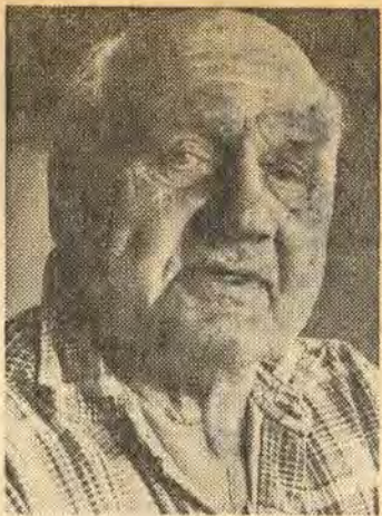
Boken kommer nog att gå med förlust

Riktigt stillsam har han förstås inte heller varit under senare år. En och annan kommu-