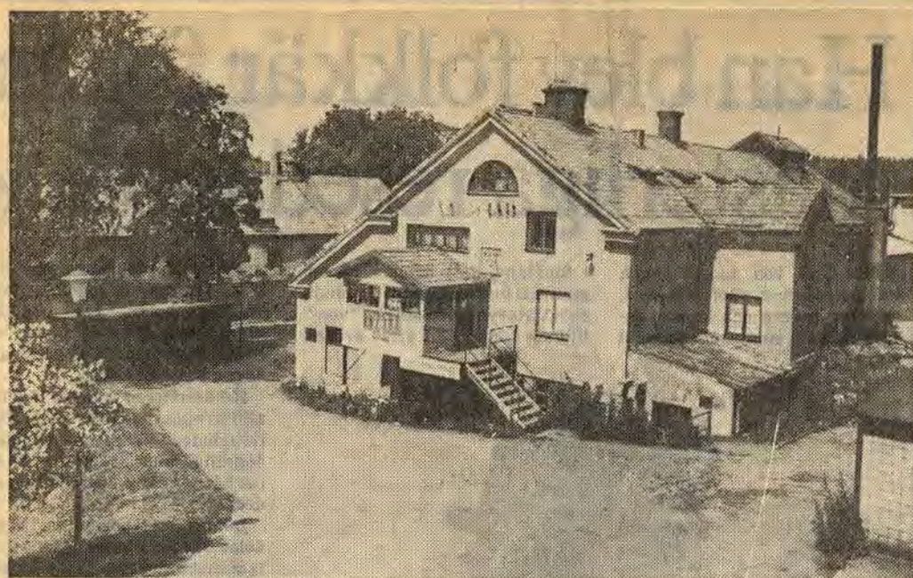
Två gamla byggnader i Åtvidaberg ska rivras för att ge plats åt ett modernt stort hus med utrymme för affärer, serviceinrättningar och, enligt planerna, bio och squashhallar. Närmast på bilden det gamla anrika varmbadhuset och tvätteriet och bakom skimtar gamla bryggeriet

I och med månadsskiftet upphörde samtliga beredskapsarbeten inom de offentliga förvaltningarna. Kvar finns en grupp om åtta personer i enskilt beredskapsarbete. Som mest var under första halvåret ett 60-tal sysselsatta i beredskapsarbete.