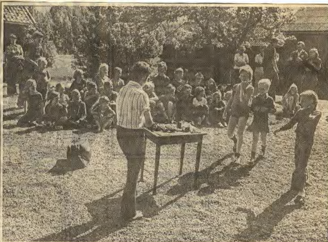
Omkring 130 personer samlades på söndagen till den s k Botorpsdagen som OK Eken varje år anordnar vid sin klubbstuga. Antalet ungdomar var stort. Bl a tävlades det i s k gängbudkavle där 30 ungdomar deltog. Alla fick pris och glädjen stod högt i tak