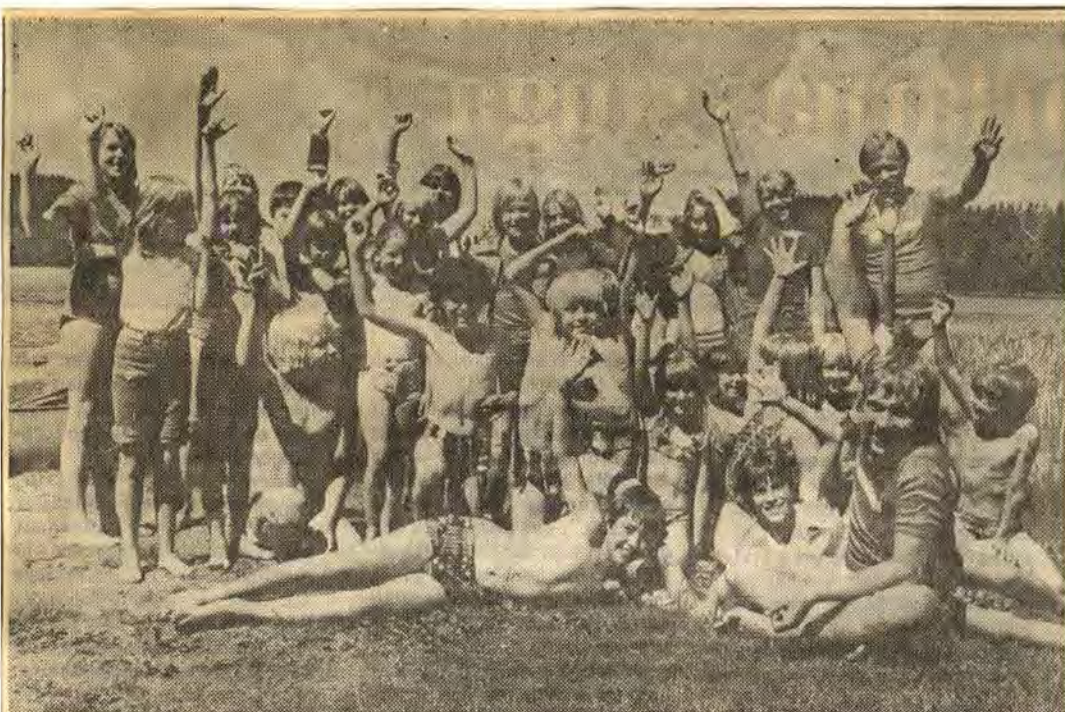
Med humöret på toppnivå poserar "Domarviksgänget" framför kameran