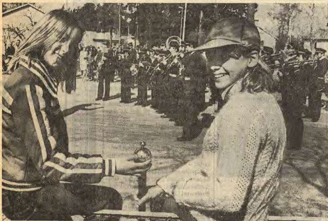
Ända sedan 1920 genomför Åtvidabergs musikkår varje första söndagen i maj en vårmarsch genom samhället. Under sex timmar spelar man sig fram på gator och torg. Ett populärt inslag i sockenbildens