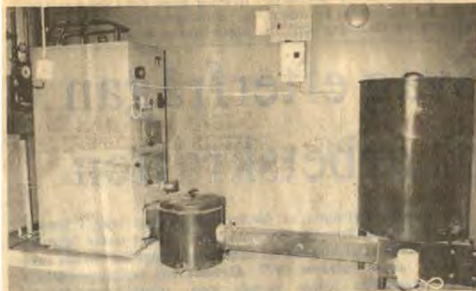
Från flisbehållaren till höger matas flisen via en skruv in i pannan. Flisen ger samma värme som olja till halva kostnaden.