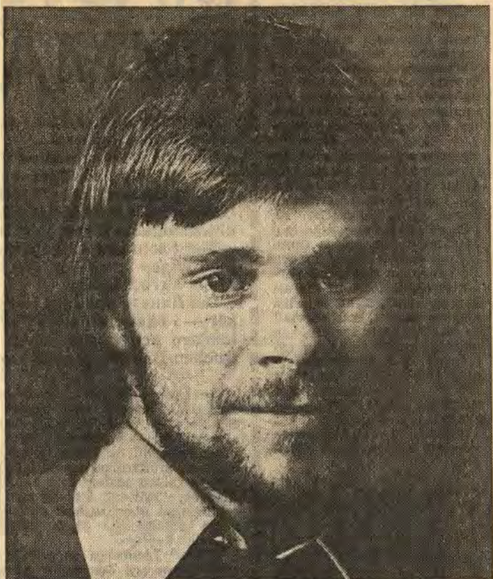
Den vinnande bilden i Åtvidabergs fotoklubs tävling Min bästa bild har tagits av Bertil Franzén

I somras bjöd Åtvidabergs fotoklubb in allmänheten till klubbens första öppna tävling. Under motot Min bästa bild fick vem som helst delta i de tre klasserna. Priser utlovades varpå arrangörerna satte sig ner för att räkna in och bedöma bilder.