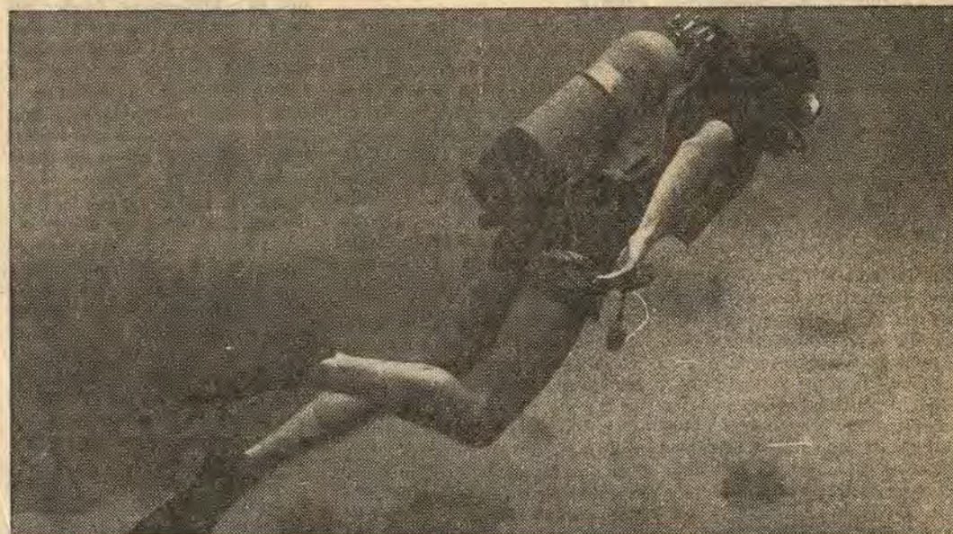
Fyrtio meter under vattenytan — ändå är sikten utmärkt

Fortsättningsvis transporterade vi per båt och buss till det ena fantastiska dykstället efter det andra. Skorstenen, Blue Lagoon, Cominotto, Pefingret, Azurwindow. Vilka världar!