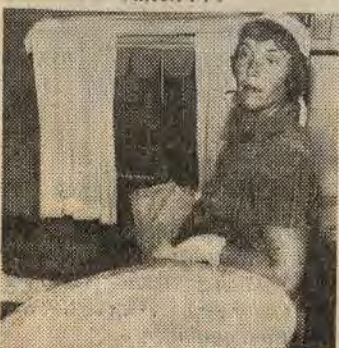
... sedan lägger man upp kakan på fjölan och skjuter in i ugnen.