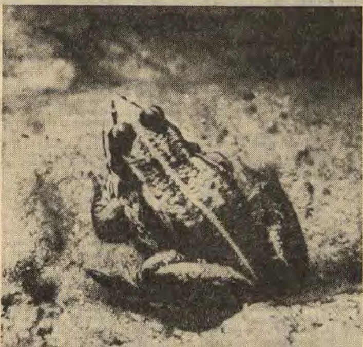
Ett skänkt exemplar av den ätliga grodan

Detta var 1975. Inte förrän nu då han träffade Olof Söderbäck har han kunnat få någon förklaring på