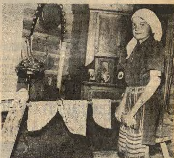
... för att slutligen hängas upp för svalning.

— För se något annat än smör det duger inte på äkta tunnbröd.