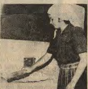
De färdiggräddade kakorna borstas av från mjöl och sot...

frågade så fick man bara till svar att man tog på en höft, på ett ungefär, så det kändes bra, som man brukade osv. Inga direkta mått som jag kunde vara nöjd med.