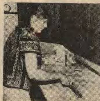
... man tar ett tag med naggen...