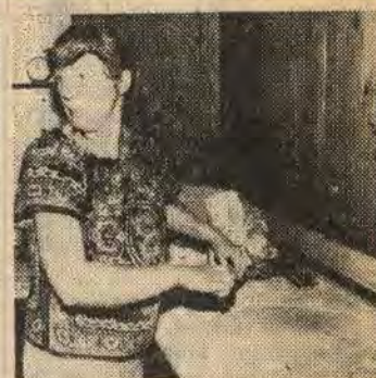
... och en vända med kruskaveln...

Själva gräddningsproceduren tog den här gången ungefär sju timmar. Ett svettigt dagsverke som dock resulterade i gott och väl hundratalet stora tunnbröds-käkor. Som faktiskt smakade anmärkningsvärt gott med äkta smör till.