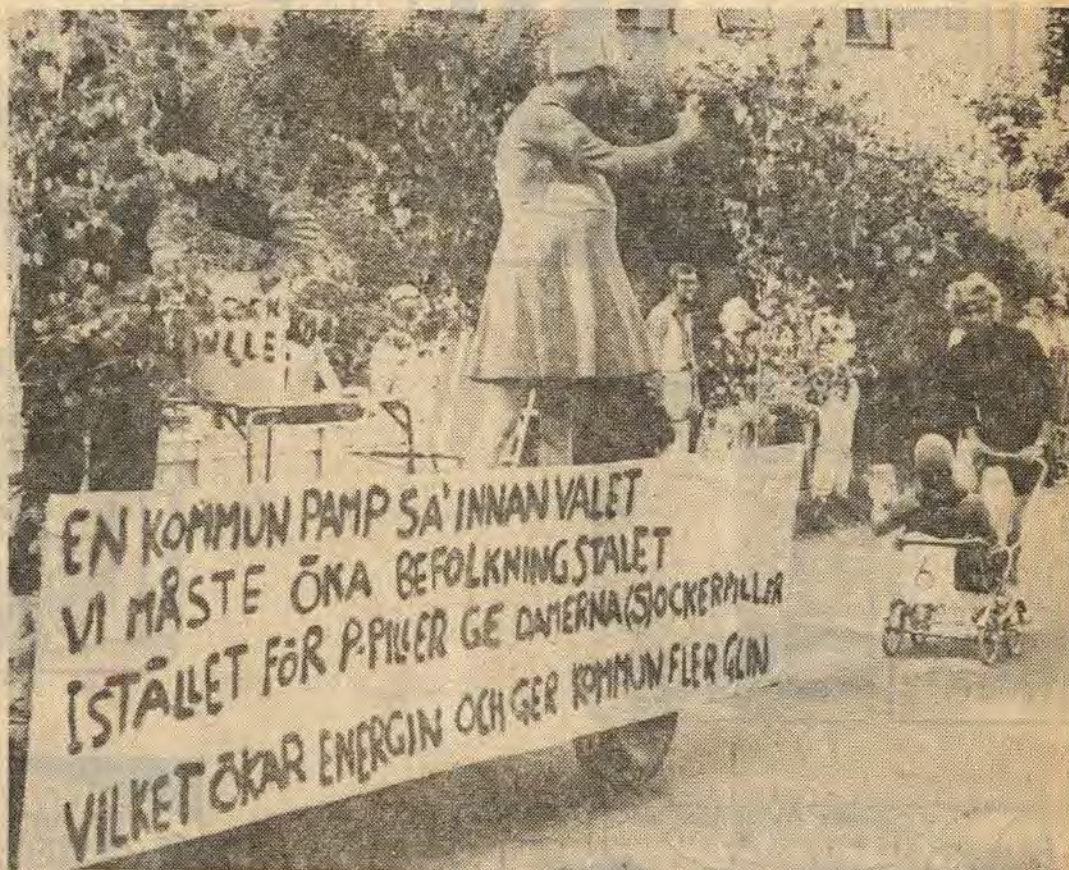
Kommunpamparna gisslades vid karnevalen i Överum