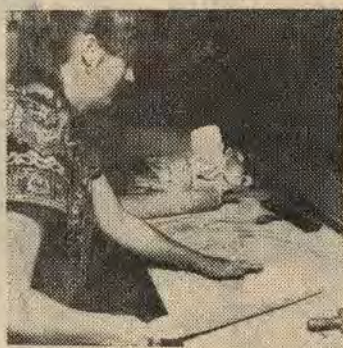
... man vänder med spjälkan...