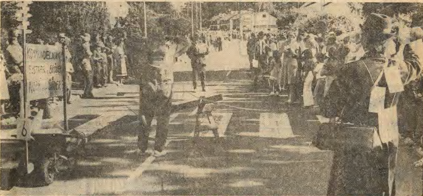
Sällan har man sett så mycket folk i Överum som vid årets karneval