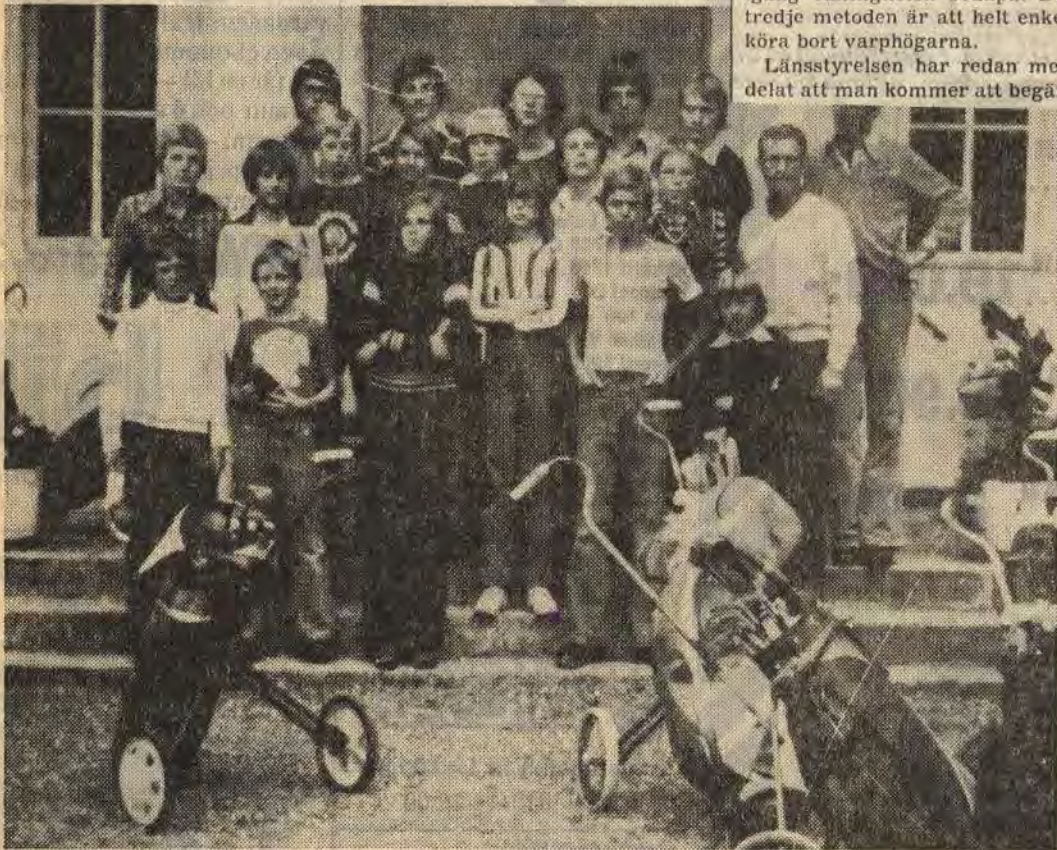
Slätterfolket, tio man och en kvinna, tar en kort vilopaus vid minnesstenen medan hemmännen bryner sina redskap

Under en veckas tid har närmare femton ungdomar från Åtvidabergs golfklubb deltagit i ett golfläger i Eksjö. Det har varit en intensiv vecka med lektioner och träning mest hela tiden. Ungdomsläget är en relativt ny satsning av golfklubben i Åtvidaberg. Det här var andra året som man gjorde en satsning på de mest lovande ungdomarna i åldern 12-17 år.