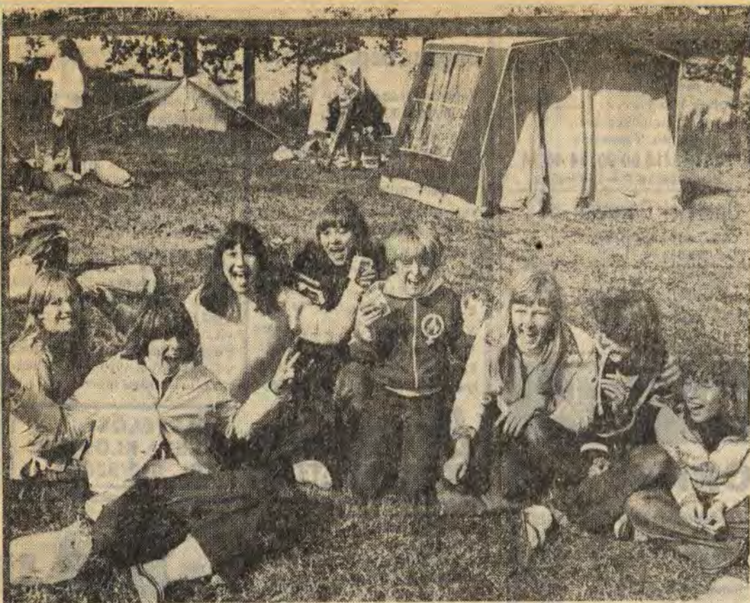
Trots ett ihållande regn och kanske inte alltför mycket sömn var humöret på topp även när Örnatta gick mot sitt slut på torsdagsmorgonen