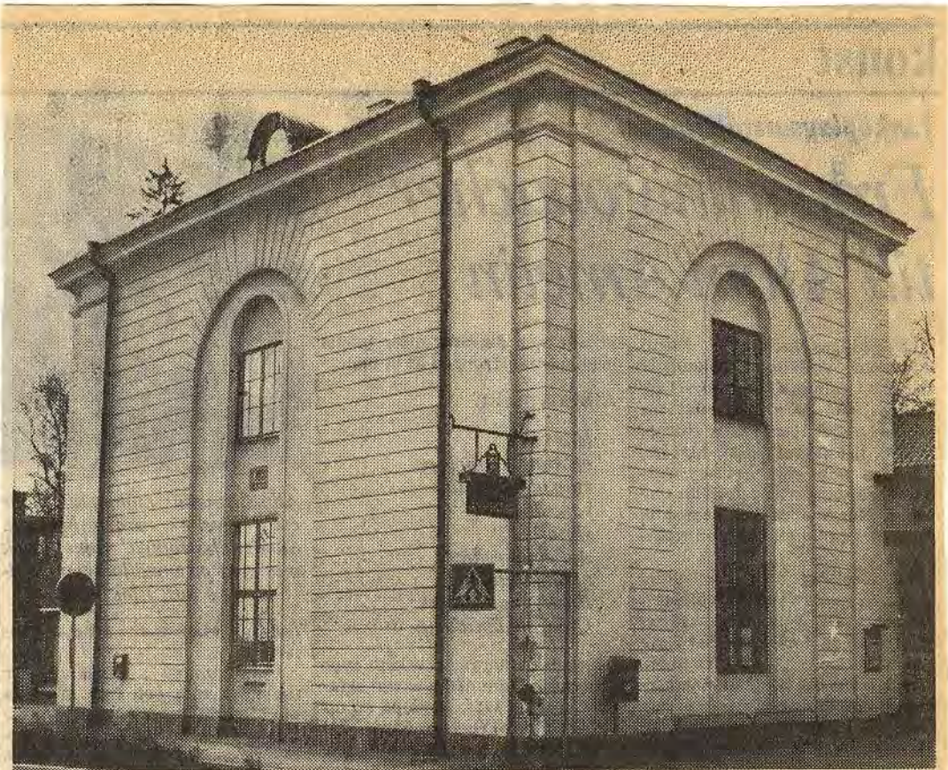
Det gamla eleganta spannmålsmagasinet byggdes 1788. Drygt 100 år senare gjordes det om till bibliotek, därefter till Folkets hus och för ett 50-tal år sedan till banklokal. 200-årsjubileet lär dock magasinet få tillbringa som pastorsexpedition