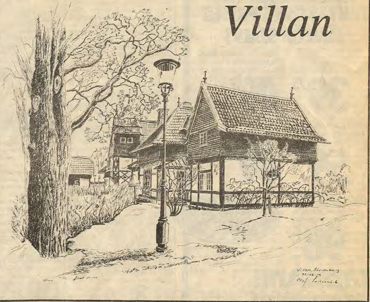
Den gamla direktörsbostaden Villan vid Bysjön. Beslutet om köpet av den ca 750 kvm stora byggnaden föregicks av den kanske längsta debatten någonsin i Årvidabergs kommunfullmäktige. Fullmäktigesalen var till bristningsgränsen fylld av besökare. För närvarande används Villan av Liljeholmens dagfolkhögskola och för olika kulturaktiviteter.