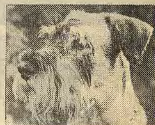
Men än så länge behöver Rocky's husse inte ta hundkörkort...

att Svenska kommunalarbetsförbundet mer eller mindre kräver att hundägarna i kom-