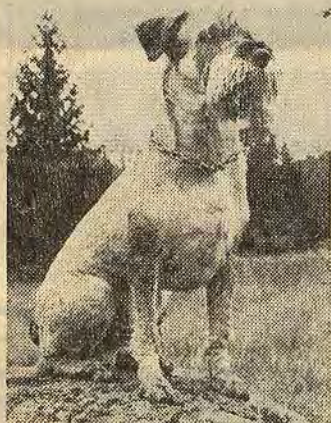
Rocky är en av Sveriges omkring 600 000 hundar...

prövats i en del kommuner — inte utan framgång. I Stockholm resulterade hundrådets arbete i att man redan efter ett år utökade antalet rastområden från omkring tio till ca 120.