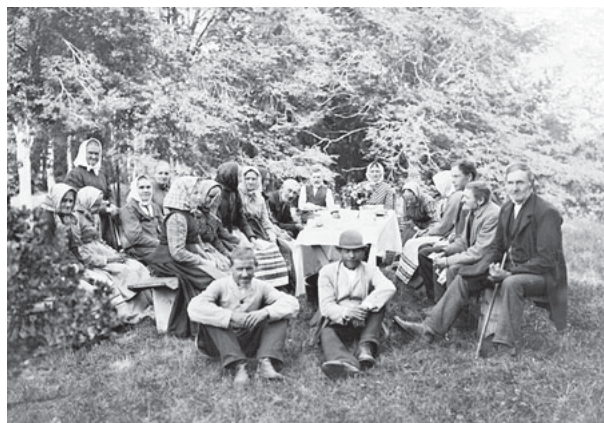
Brukets ”pensionärer” utanför fattighuset 1905.

Fattiga barn kunde få särskilt stöd genom särskilda fonder understödda av brukets ledning. I Åtvidaberg delades gåvor ut vid jultid till behövande barn i form av ett par skor, en påse godis och liten svensk flagga. Vid tiden för första världskriget var emellertid ekonomin kärv. Man blev tvungen att minska gåvans värde. Vad skulle man dra ner på? Krig föder nationella känslor, så det blev gottpåsen som uteslöts – barnen fick skor och svensk flagga. Vissa forskare anser att just gåvor – i olika former från en bruksledning till bruksbefolkning – har spelat stor roll inom bruksystemet för att skapa lojalitet mellan bruksarbetarna och bruksledningen och därmed konservera ett patriarkalt system.