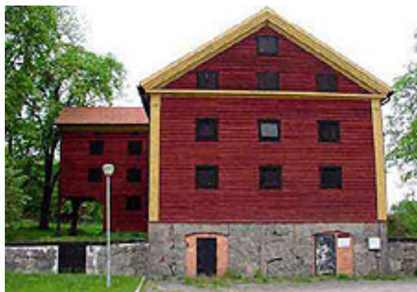
Brukets spannmålmagasin vid övre bruksdammen. Magasinet byggdes på 1860-talet.

Bostaden för en bruksarbetarfamilj i Åtvidaberg var fram till 1890-talet en annan del av löneförmånen. Bostadsstandarden var fram till denna tid dock i särskilt hög, även om den säkerligen var sämre i många andra bruksorter. Mot slutet av 1800-talet kom dock bostadsfrågan för arbetarfamiljer att diskuteras intensivt i samband med växande slumbebyggelse i industriella miljöer både i Sverige och i utlandet. Det var den industriella revolutionens baksida. De sociala problemen blev allt akutare. Den sociala frågans lösning fanns enligt många debattörer – inte minst bland bruksherrar som Theodor Adelswärd – i den goda bostaden – det egna hemmet. Egnahemsrörelsen i Åtvidaberg styrdes helt från bruksledningens sida, men medförde åren kring 1900 en radikal förbättring av bostadsstandarden för ett betydande del av bruksbefolkningen.