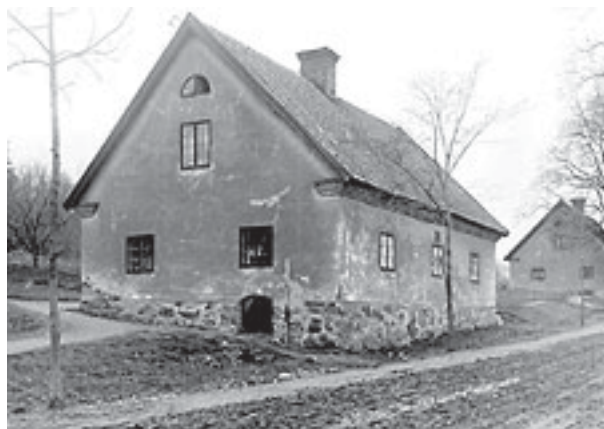
Arbetarbostäder vid Åtvidaberg för sex familjer.