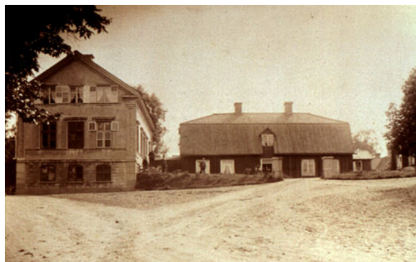
Det högt belägna brukskontoret, "blickande" ut över Åtvidabergs kopparbruk. Foto Augusta Zetterling 1860-talet.

monumental bruksarkitektur. Med förebilder från främst de uppländska vallonbruken uppfördes arbetarbostäder, industribyggnader, brukshotell, kyrkor och bruksherrgårdar i 17- och 1800-talets bruksorter, där ofta ytterst välrenommerade arkitekter anlätades. Bruksarkitekturen från denna tid kom därför att hålla en hög klass. Bruksbebyggelsens fysiska placering följde ett strikt utvecklat mönster. Topografin utnyttjades för att extra tydligt framhäva representativa byggnaders symbolvärde. Detta kom i hög grad att gälla i Åtvidabergs bruksbygd. I brukssamhället dominerade den raka Bruksgatan med vitrappade arbetarbostäder, vilken ledde fram till det ståtliga Stallet. I bruksomlandet uppfördes ett stort antal herrgårdar och mindre bruksmiljöer i enhetlig senempirstil, så kallad Jonssonempir eller Tjustempir.