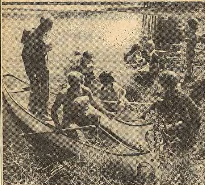
Många passade på tillfället att prova på kanoting under Dojan-dagen i Åtvidaberg

Närmare 200 åtvidabergare deltog i den av friluftsrådet anordnade Dojan-dagen på söndagen. Förutsättningarna för arrangemanget var de bästa tänkbara. Solen lyste från en molnfri himmel och naturen i Humpaområdet stod i försommarsfager flor.