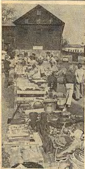
ÅIF:s årliga loppmarknad har ägt rum under dagarna tre. Föremål av alla de slag såldes. Det blev ett nytt prydligt försäljningsrekord. Bruttoinkomsten uppgick till 17 000 kr, medel som skall användas till föreningens ungdomsverksamhet