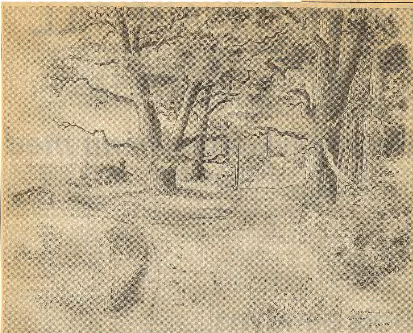
På teckningen ses en del av Humpaområdet som Åtvids naturförening värnar om. Just den här platsen var för övrigt ett alternativ för den omdiskuterade genomfarten av Kisavägen. Teckningen är gjord av Olof Söderbäck

Åtvids naturförening till länsstyrelsen: