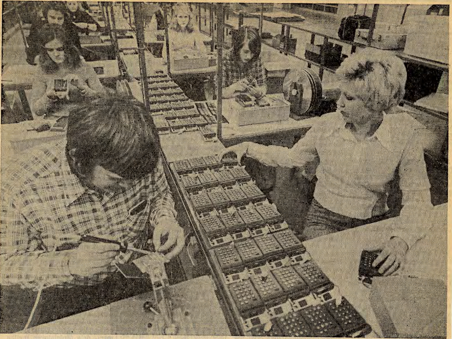
Monteringsbandet för den miniräknare som nu tas ur produktion