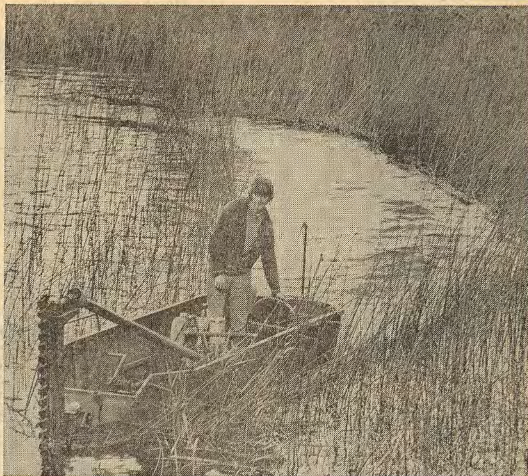
Så här blir resultatet när Lennart Stolpe kört en vända med sin vassklippningsmaskin. En drygt två meter bred remsa klipptes av i den täta vassen