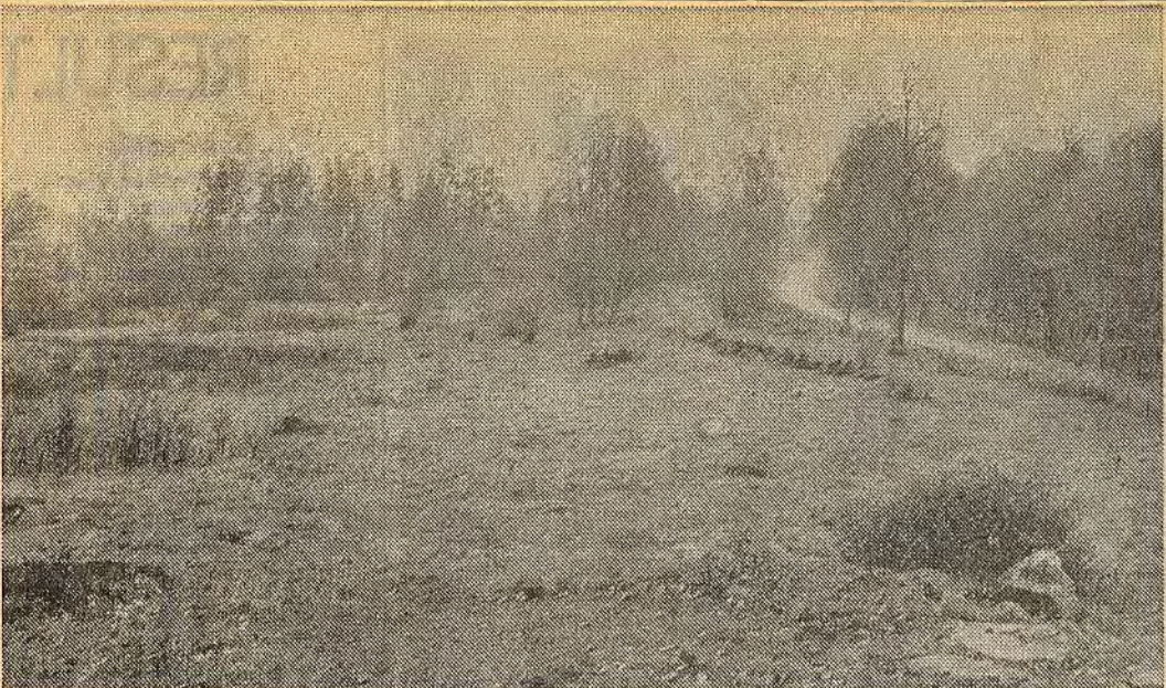
Ungefär 60 procent av de 4 500 personer som beräknats få plats i ett nytt bostadsområde i Åtvidaberg kommer att bo i egna hem enligt det programförslag som nu är färdigt. Hela området är 136 ha och sträcker sig från vägen till Mormorsgruvan (t h på bilden) till Nygårdsvägen