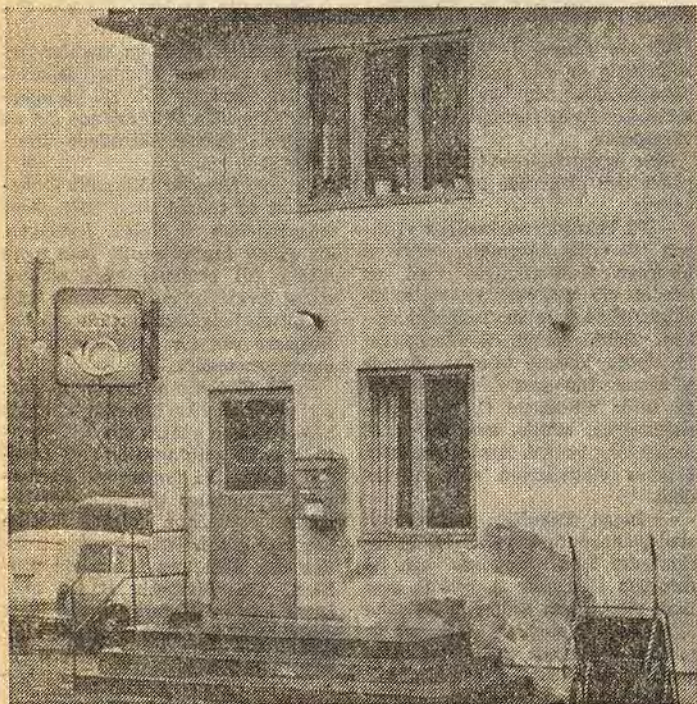
Den nedläggningshotade poststationen i Falerum

Inget speciellt tycks ha inträffat som motiverar en nedläggning av posten i Falerum just nu. Det enda skäl som postverket kan åberopa är att vakans snart uppstår på föreståndarbefattningen. Ur kommunal synpunkt ställer vi oss tveksamma till att tidpunkten för pensionering av olika befattningshavare skall vara avgörande för vilken service det allmänna kan ge. Det säger kommunstyrelsen i Åtvidaberg i förslag till yttrande över postverkets planer på att dra in postexpeditionen i Falerum. I verkets långsiktiga planer för landsbygdens postanordning finns Falerum upptaget som ort "vars framtida postala betjäningssform skall undersökas vid uppkomna vakanser".