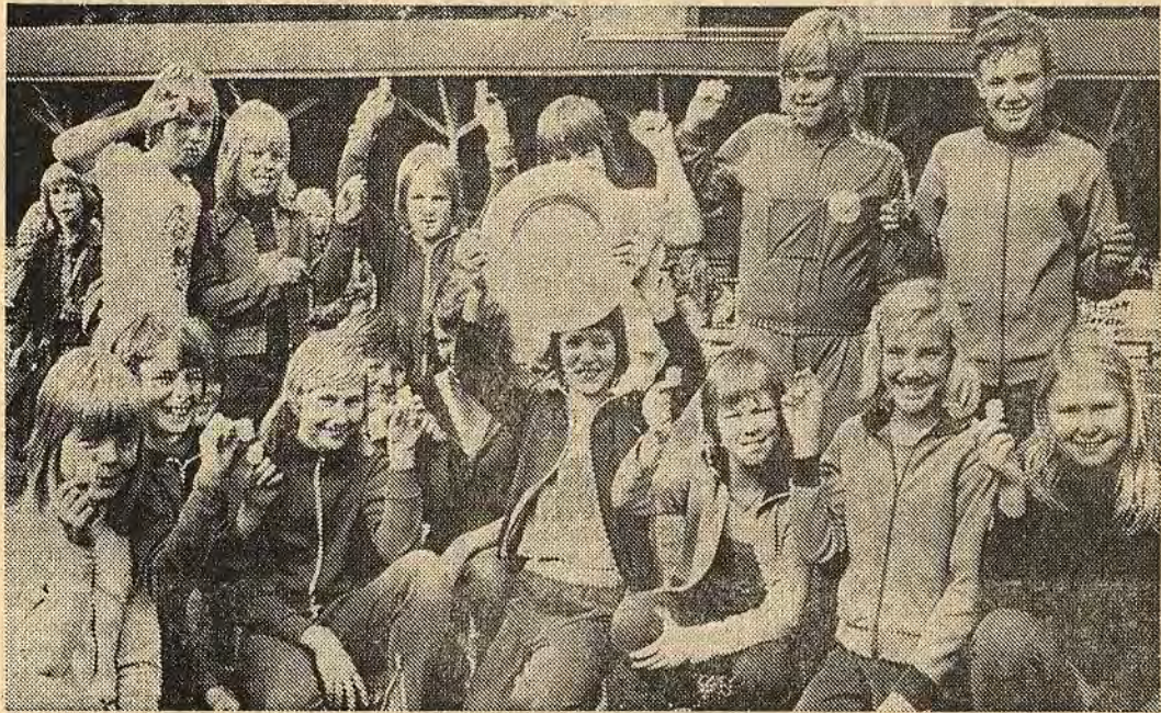
Centralskolan vann överlägset skollandskampen över Långbrottsskolan i Åtvidaberg. På bilden ses samtliga grensegrare