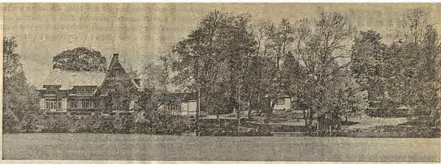
Den fd direktörsbostaden Villan i Atvidaberg. Nu föreslås uppförandet av en 60 m lång byggnad till höger om Villan