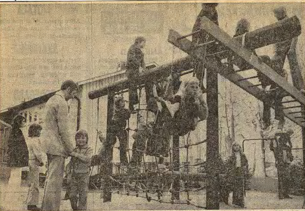
Atskilliga frivilliga arbetstimmar har föräldrarna till förstaklassarna i Centralskolan lagt ner på att förbättra skolmiljön för sina barn. Klätterställningen på bilden är ett resultat