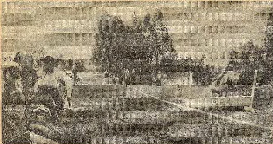
Åtvidabergs ridklubb anordnade på söndagen den första ridtävlingen över huvud taget i Åtvidaberg. Tävlningen, som var öppen endast för klubbens egna medlemmar, utgjorde också avslutning på en intensiv säsong