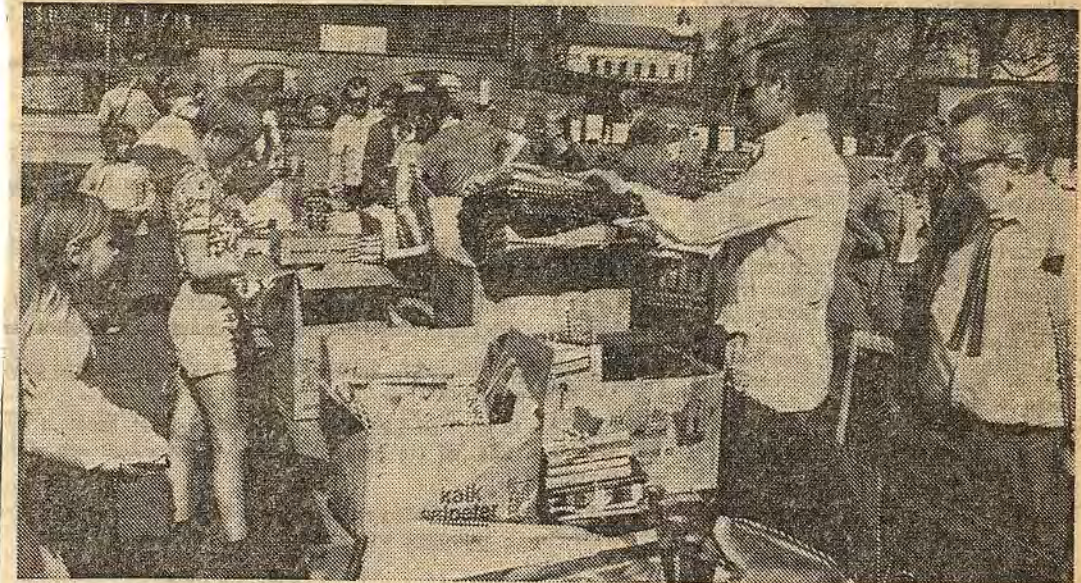
Mycket folk sökte sig under dagarna tre till AIF:s loppmarknad i Åtvidaberg

I dagarna tre har Åtvidabergs idrottsförening anordnat loppmarknad på tusentals gamla prylar. Under torsdagen och fredagen höll man till på kvällstid i sporthallens foajé och i lördags startade man på Alundaplan redan kl 8 på morgonen. Då hade flitiga medlemmar sedan flera timmar tillbaka kämpat och burit, flyttat och lyft ut rader av bord, stolar, kylskåp, spisar, sängar, skåp, böcker, gamla skolplanscher, mystiska handtryckapparater, såpkoppar, vävnader och