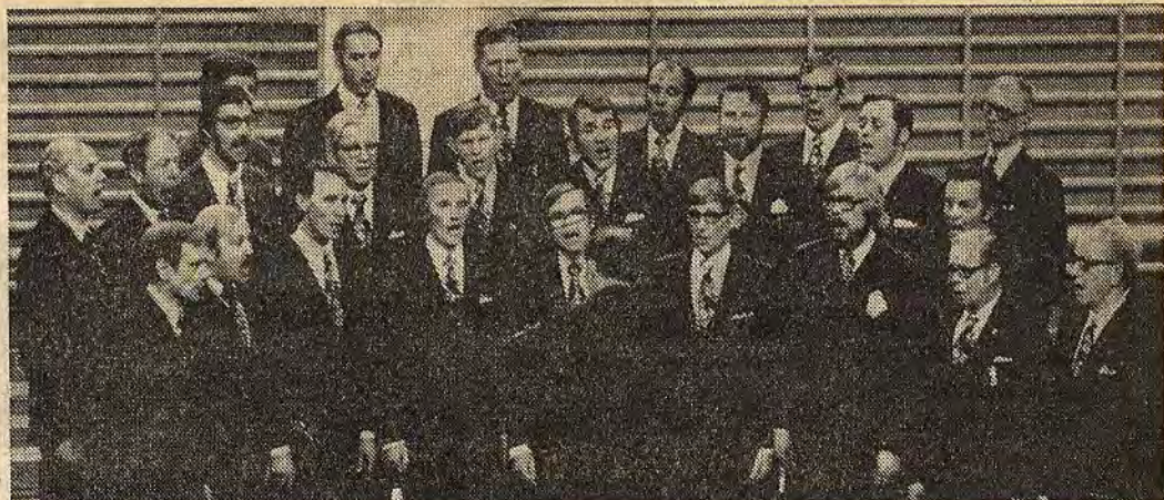
DET HÄR ÄR Sångarbröderna i Mjölby, som vann något omdiskuterade första körtävlingen i Östergötland. Vår bild från Åtvidabergstävlingen var tyvärr inte den rätta — den föreställde nämligen Rimforsakören. Här är alltså de verkliga segrarna i full aktion under uppsjungningen

På ena sidan är Erik av Pommerns sigill avbildat och på den andra står: "Åtvidabergs kommun — för värdefull insats". Sannolikt utdelas plaketten i samband med den avslutningssupé som följer på kommunfullmäktiges sista sammanträde för året.