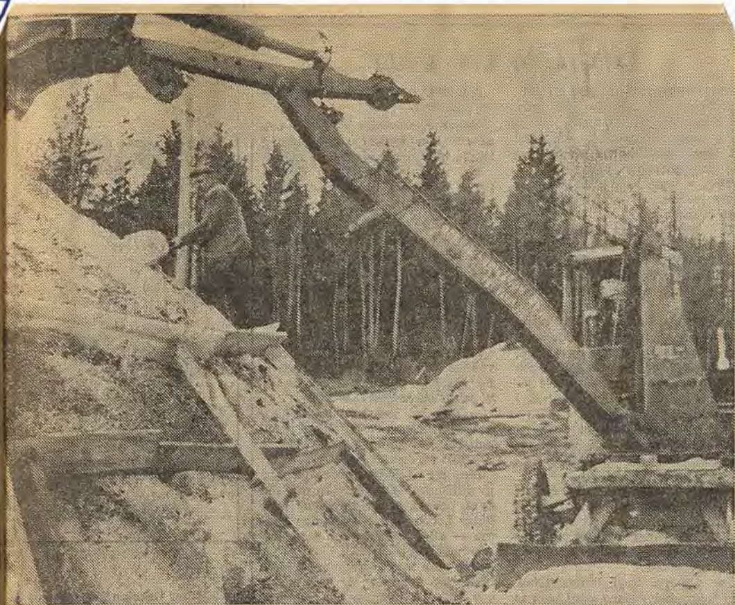
Sedan man rest veden skall milan stybbas. Omkring 60 kubikmeter sågspån går det åt. Gösta Svensson och sonen Bertil vid spakarna hjälps åt med arbetet