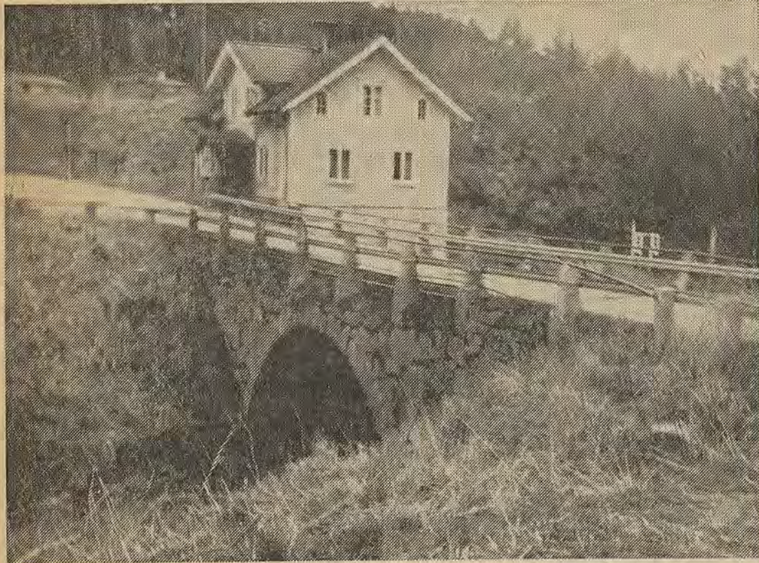
Den hundraåriga stenbron vid Falerum har snart tjänat ut. Vid ett möte i Falerum mellan representanter för vägförvaltning, markägare och kommun var man överens om att en ny bro behövs