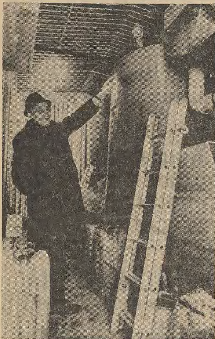
6 det nya reningsverket, det första med sk trestegsrening i Hannäs

Den allmänna vårdanstalten Hägerstad i Hannäs har sedan en månad tillbaka haft sin nya reningsanläggning i gång. Reningsverket, ett så kallat KB-verk levererades komplett och provkört från Gustafsbergs fabriker. Det ger en 90-procentig rening av anstaltens avloppsvatten och är för det första i Hannästrakten som fungerar enligt trestegsmetoden.