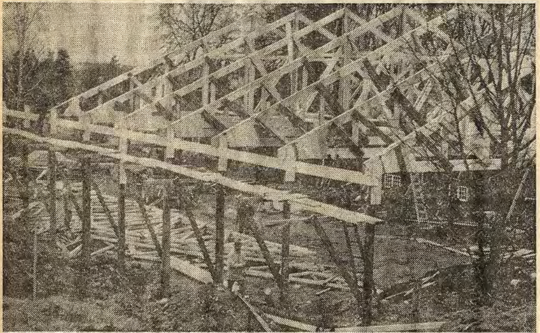
En milstolpe i ridhusbygget passerades i lördags när medlemmarna i Åtvidabergs ridklubb satte takstolarna på plats

Åtvidabergs ridklubb tillhör de yngre föreningarna i Åtvidaberg, men är för den delen varken den minsta eller minst aktiva. Under sin knappt två år gamla historia har man hunnit med att registrera inte mindre än omkring 150 medlemmar. En ansenlig siffra inte minst med tanke på Åtvidabergs storlek och att man bara har tillgång till sex hästar.