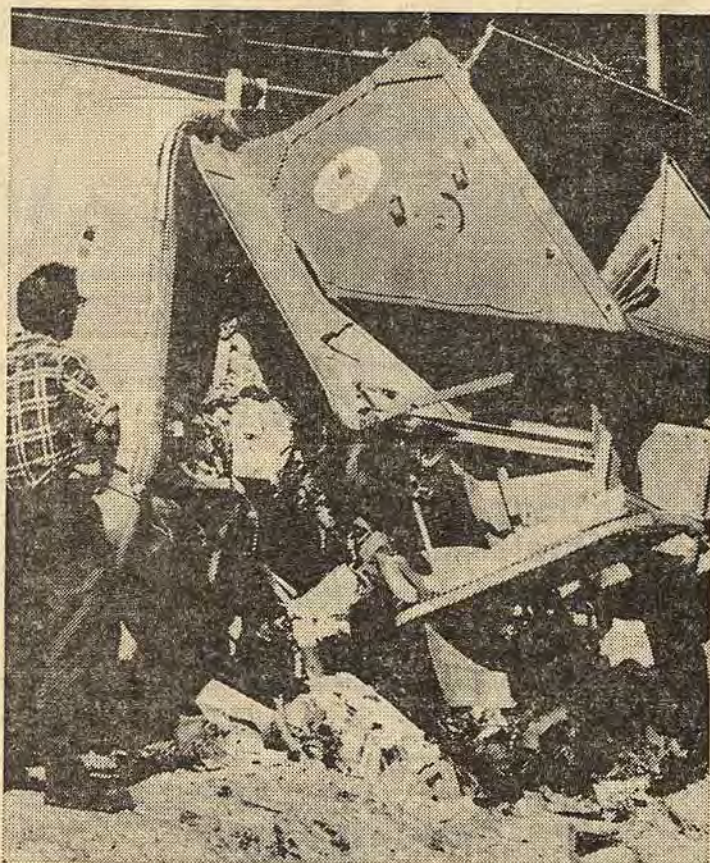
Första lasset sopor vid den nya sopstationen i Atvidaberg lämpades av tidigt på måndagsmorgonen. När det sista lasset tippas om ca 13 år skall man ha pressat samman ett över två meter tjockt lager av avfall. Ovanpå kommer man att plantera skog

Den gamla förbränningsmetoden medförde luftföroreningar. Det kommer man helt ifrån nu under förut-