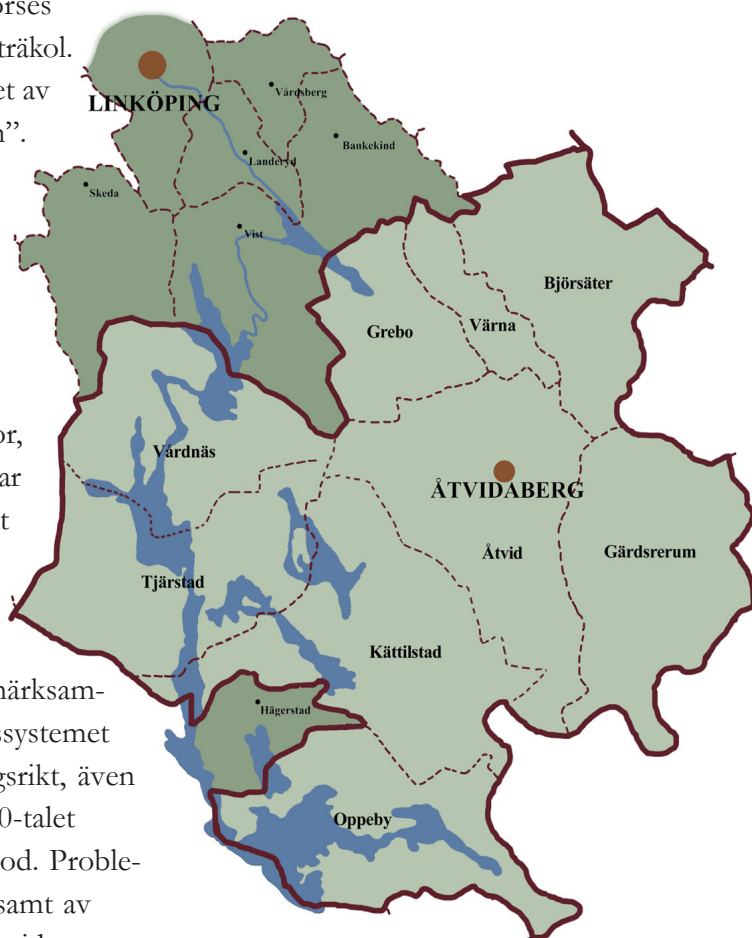
Åtvidabergs bergslag. De nio socknar utgjorde kopparverkets kolhandelsdistrikt.