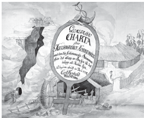
Tidig bild av industriell verksamhet i Åtvidaberg. Kartusch från C.B. Wadströms karta över Åtvidaberg 1772.

Centrum i detta system av bruk, gruvor, jord- och framför allt skogsegendomar var godset Näs, som från denna tid kom att kallas Adelsnäs. Gradvis anlades en imponerande parkanläggning kring herrgården. Adelsnäs trädgårdskonst har allt sedan denna tid rönt stor uppmärksamhet. Det alltmer välorganiserade brukssystemet var även mycket ekonomiskt framgångsrikt, även om viss lågkonjunktur i början av 1800-talet drabbade kopparverket en kortare period. Problemen förstärktes vissa år av svår torka samt av en omfattande brand i Bersbo gruvfält vid mitten av 1820-talet.