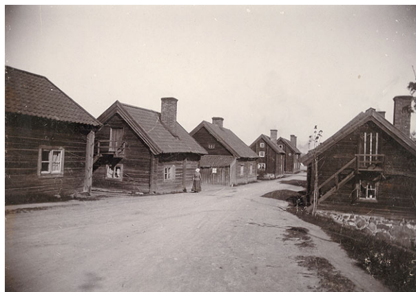
Bostäder för kopparverkets arbetare uppförda 1770-1800.